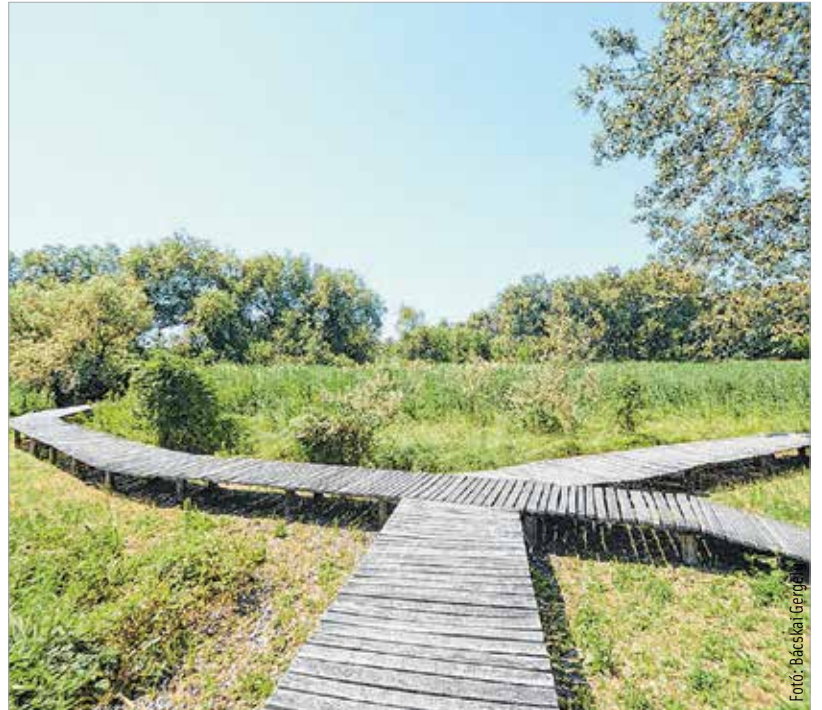
Jövőre itt lesz a város egyik oázisa