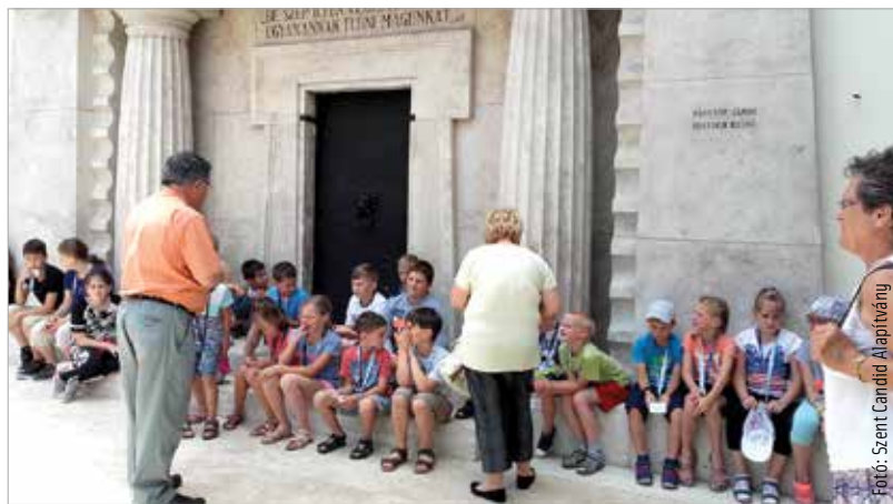
Pihenő a Székesegyház altemplomának bejáratánál

„Egy fehérvári vagy fehérvári kötődésű kisgyermeknek illik ismerni azokat a csodákat, amelyek fellelhetők a városban, és látniuk kell a mai felnőtteknek az erőfeszítését is, mellyel ezeket az emlékeket örökíteni, ápolni, gondozni akarják.” – tette hozzá a kurátor.