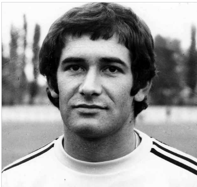
Amikor még Sóstó felett ragyogott az ég...

1984-ben rövid időre Békéscsabára került, de idény közben átigazolt Siófokra, ahol közel há-