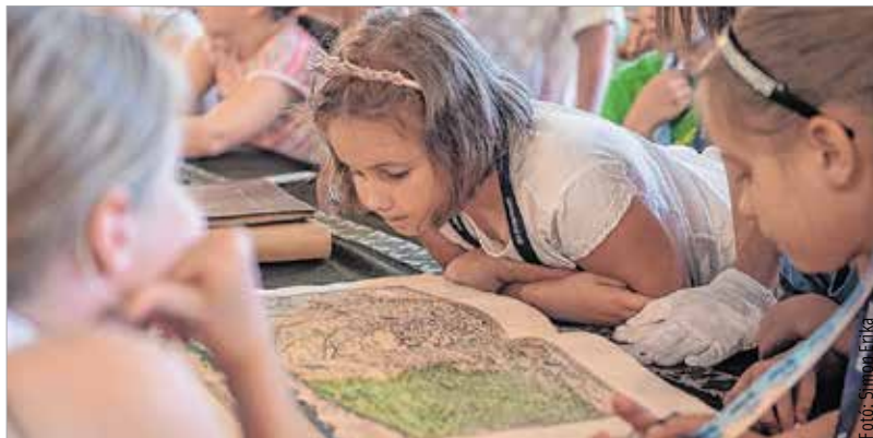
Több száz éves könyvekbe is „belebújhattak” a gyerekek