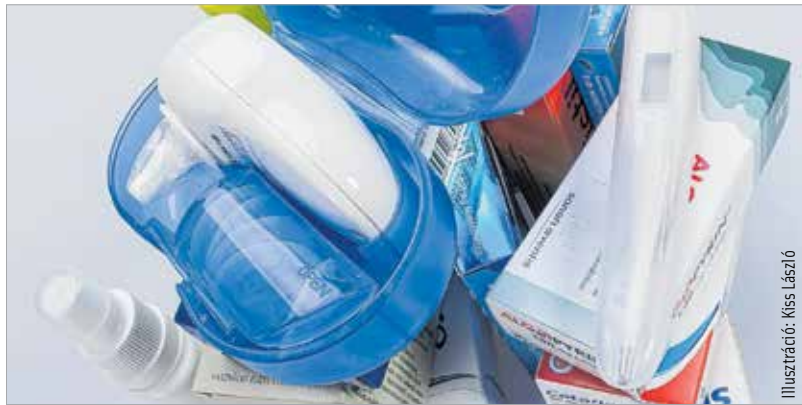
Illusztráció: Kiss László

A krémeket és kúpokat lehetőleg hűtőtáskában szállítsuk, és ha tehetjük, akkor a nyaralás alatt is tartsuk ezeket hűtőszekrényben vagy hűvös helyen. Az úti patika összeállításában érdemes kikérni a háziorvos illetve a gyógyszerész tanácsát, véleményét.