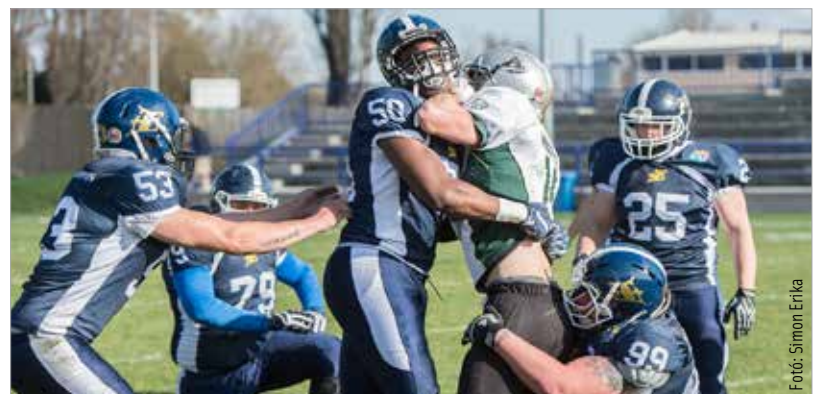
Ismét egymásnak feszül az Enthroners és az Eagles. Eddig a fehérváriak örülhettek.

Erős Márkék mind a hét meccsüket megnyerték eddig, így a tabella első helyén végeztek. A Fehérvár Enthroners 313 pontot szerzett a pályán, és csupán 48 pontot kapott. A küzdelem azonban még nem ért véget, hiszen a végső dicsőség érdekében a mindent eldöntő szombati összecsapáson is győznie kell az Enthronersnek.