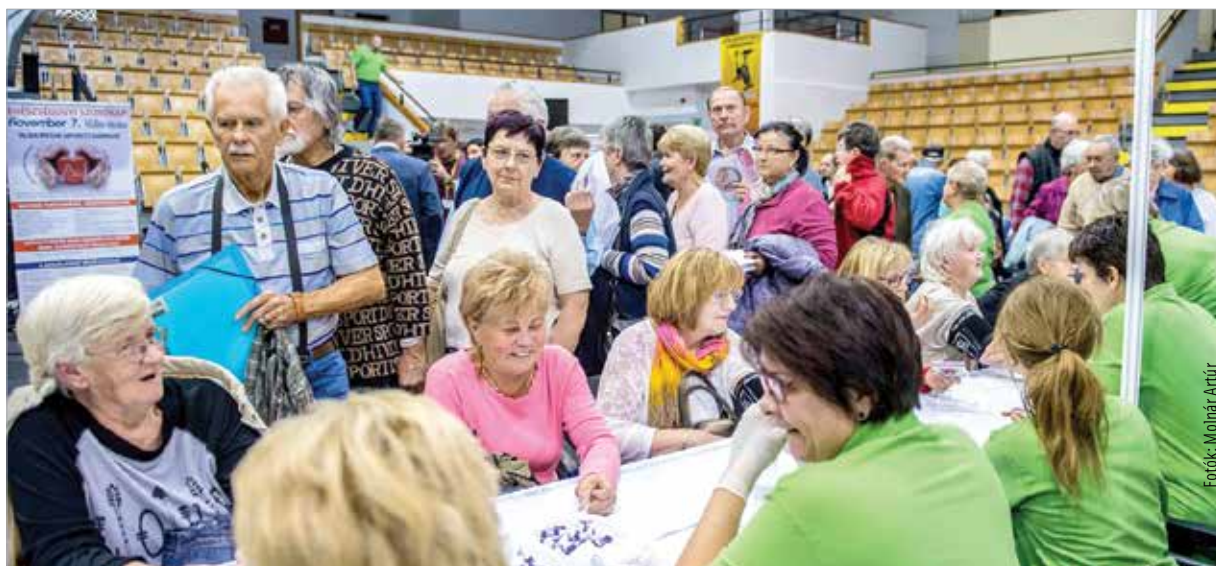
A legkülönbébb vizsgálatokon, tanácsadásokon vehettek részt az ötödik alkalommal életre hívott szűrőnapon

ezer résztvevő azóta is, évről évre folytatásra ösztönzi a szervezőket. Csak tavaly közel két és félezer szűrővizsgálatot végeztek el a program keretében. A rendezvényen minden megvizsgált személy egy papíron kapta meg az eredményeket. Abban az esetben, ha eltérést tapasztaltak a szakemberek, a háziorvos vagy a szakrendelő felkeresését javasolták a páciensnek. A szűrőnaphoz kapcsolódóan képzőművészeti pályázatot is hirdettek az óvodáknak. A gyerekek bármilyen technikával elkészíthették alkotásaikat az egészség, az egészségmegőrzés és az egészséges táplálkozás jegyében. Az eredményhirdetésre szerdán került sor. Az első helyen a Hoszszúsétatéri Óvoda, a másodikon a Zombori úti Szivárvány Óvoda, míg a harmadik helyen a Szivárvány Óvoda Püspökkertvárosi Tagóvodája végzett. A díjakat Törő Gábor országgyűlési képviselő adta át, a díjátadón részt vett Östör Annamária egészségügyi és sporttanácsnok és Tanka Csaba, a Fejér Megyei Közgyűlés alelnöke is.