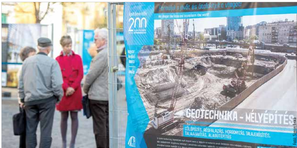
A Városház téren megismerhetjük az utóbbi évek magyar mérnöki alkotásait

A vándorkiállítás november 11-ig látható városunkban, majd Békéscsabán, Kecskeméten, Győrben, Szolnokon és Baján is bemutatják a következő hetekben.