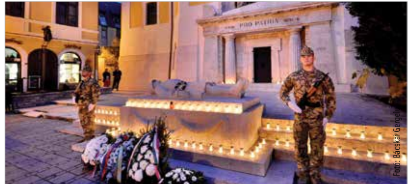
Az első világháborús hősökért égtek a gyertyák

kezdődtek, majd a Vörösmarty téren folytatódott a Császári és Királyi 69-es Gyalogezred emlékművénél. Emlékeztek a Zichy ligetben, a Magyar Királyi 17-es Honvéd Gyalogezred emlékművénél, majd a Városház téren a 10-es Huszárezred emlékművénél és a Fekvé katona szobránál, hogy a csatatereken maradt déd- és ükapák hősi katonai helytállása, küzdelme ne merüljön feledésbe!