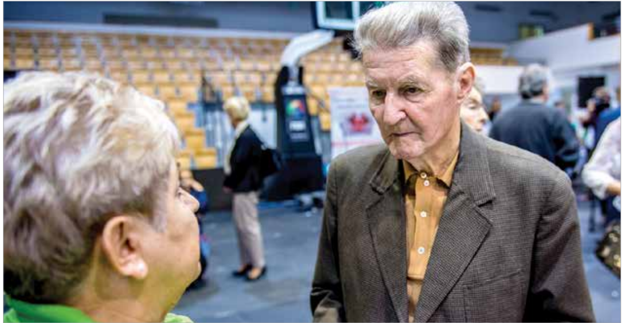
A szűrőnapra érkezőket közel száznegyven kórházi szakember segítette a vizsgálatok alatt

A szűrőnapra érkezőket közel száznegyven kórházi szakember segítette a vizsgálatok alatt. A betegségek felszínre kerülése