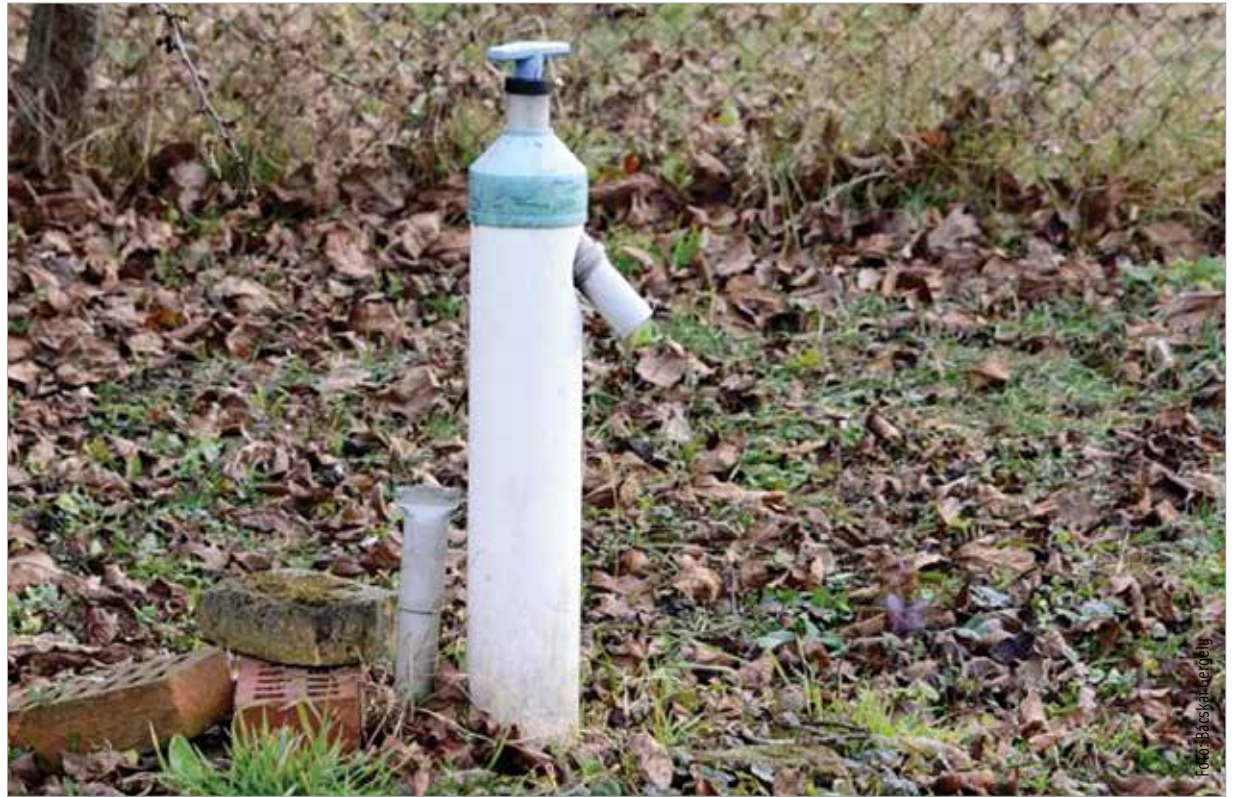
Nem csak az ásott kúthoz, a fúrt kutakhoz is kell engedély!

„A hatályos jogszabályok értelmében mentesül a vízgazdálkodási bírság kiszabása alól az, aki 2018. december 31-ig az engedély nélkül létesített kutakra megkéri a fennmaradási engedélyt. Ez nem pusztán egy bejelentési kötelezettség, hanem egy műszaki dokumentáció az alapja, amit egy a mérnöki kamaránál bejegyzett szaktervezőnek kell elkészítenie.” – mondta Kálmán