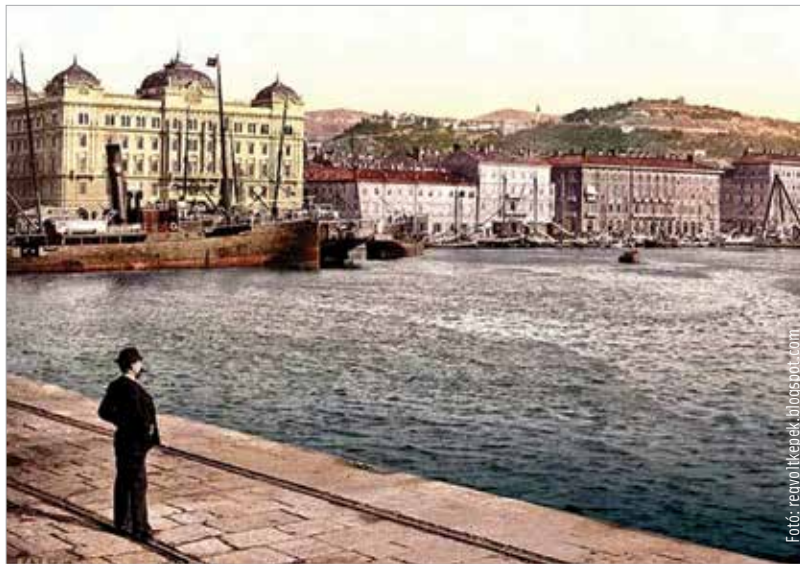
Fiume a XIX. század végén