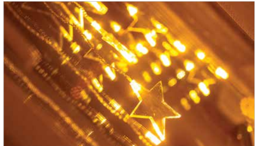
A lakás adventi hangulata az ablakdíszszel kezdődik

éreltük a napon! Kotorjuk elő a felső szekrényből a karácsonyfadíszeket, és válogassunk kisebb-nagyobb színes, fényes vagy matt gömböket! Szórjuk bele mindet az