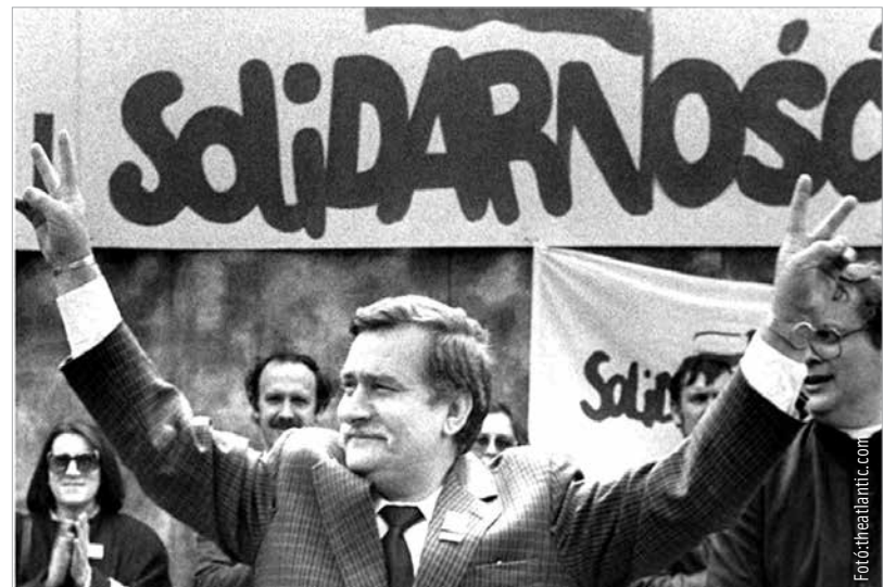
Lech Wałęsa (1943–) a Szolidaritás szakszervezeti mozgalom vezetője

lat tevékenységének. A rendszer brutalitását és egyben csődjét mutatta, amikor 1984. október 19-én a belügyminisztérium utasítására különös kegyetlenséggel meggyilkolták Jerzy Popiełuszko atyát, „a Szolidaritás lelkészét”. Közel