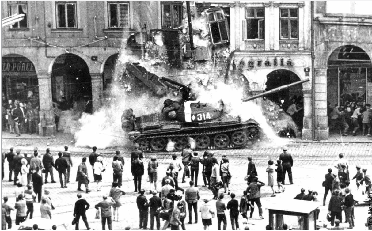
A csehszlovákiai invázió egy pillanata (1968. augusztus 21., Prága)