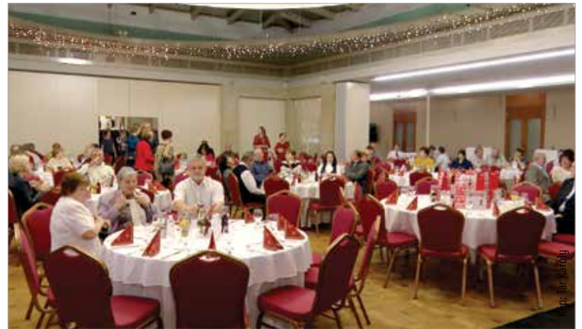
A mindennapi hősök rengeteg alkalommal adtak vért, s mentettek meg ezzel háromszor annyi életet

„Igazán megérdemlik ezt a véréadóink, hiszen szervezetünk az év háromszázhatvanöt napján segítséget kér a rászoruló emberek nevében. Lennie kell legalább egy napnak, amikor mi is adni tudunk valamit a köszönő szavakon túl!” – fogalmazott a megyei igazgató.