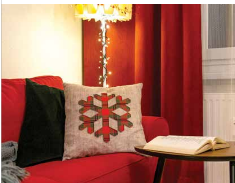
Kényelmes kanapé, meleg színek, hangulatlény és egy jó könyv. Mi kell még?