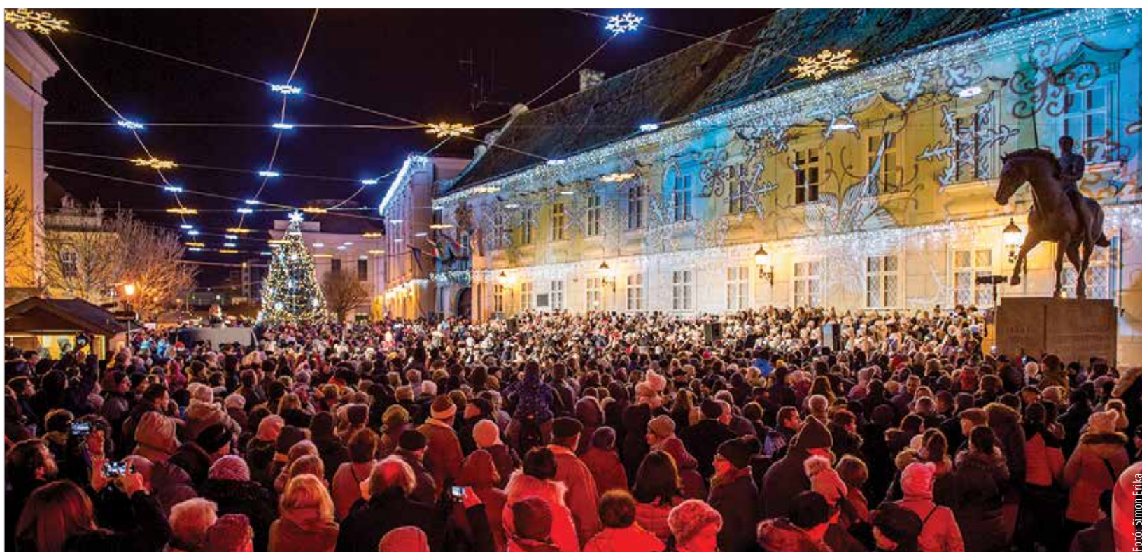
Advent első vasárnapján a Városház téren a négyszázötven fehérvári kiskisnőből álló Kisangyalok kara, az egyedülálló alkalmi kórus hagyományos karácsonyi dallamokkal örvendeztette meg a város lakóit