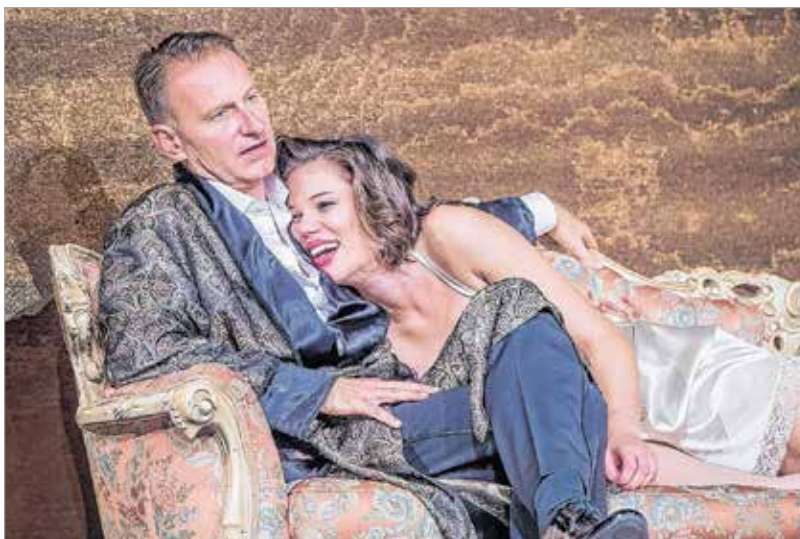
Hogy lesz ebből happy end?