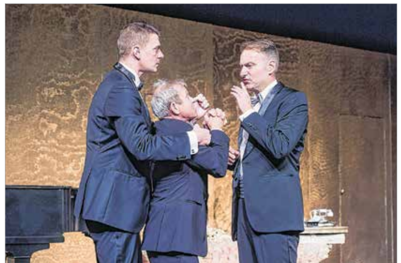
Nyugalom, ura vagyok a helyzetnek!