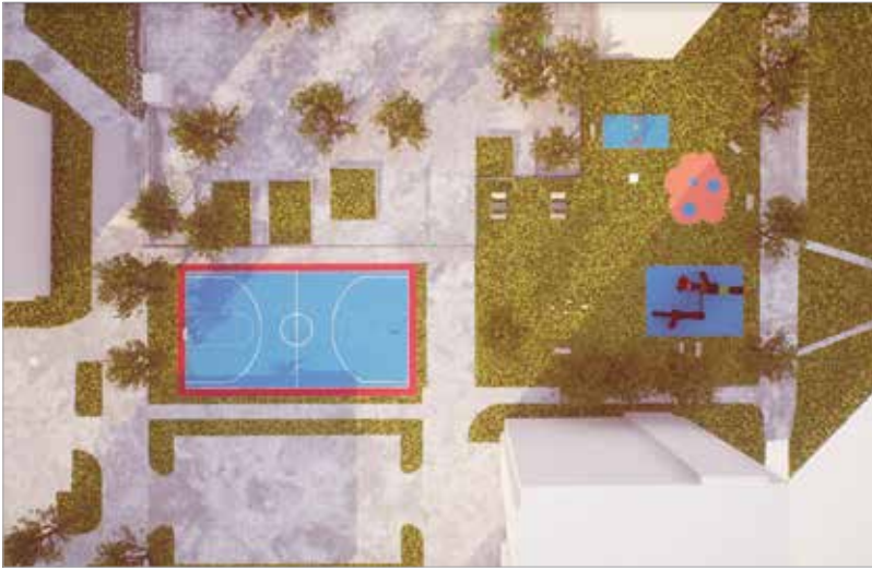
Jövő tavaszra fejeződhetnek be a munkálatok: a tervek szerint így fog kinézni a tér