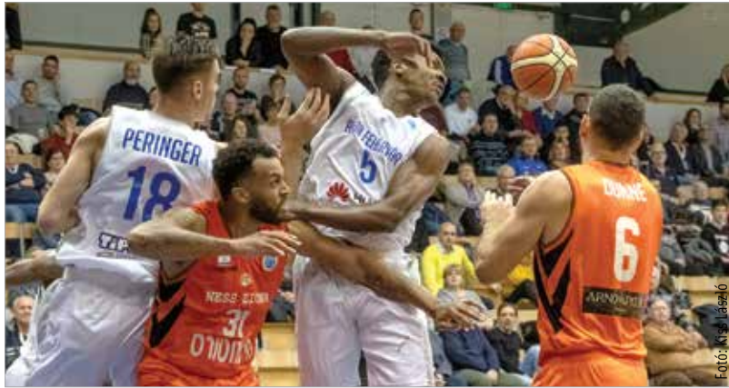
Nem jár kézről kézre, és nem is engedelmeskedik mindig a labda a fehérváriaknak

Európa-kupában, a FIBA pedig úgy oldotta meg a helyzetet, hogy helyettük továbbjuttatja azokat is, akik amúgy nem jutnának... Így aztán nem a kiesés miatt bosszankodtunk a Nesz Ciona ellen, a 96-80-as újabb sima vereségnek inkább a játék képe miatt volt rossz üzenete. A második féléldőben nem védekezett az Alba, fegyelmezetlenek voltak a játékosok, ez pedig megengedhetetlen, amikor amúgy is nehéz helyzetben van a csapat. A bajnokságban pénteken Szegeden játszanak Freemanék, utána három hét szünet következik. Talán az utolsó lehetőség, hogy összeszedje magát az Alba és hagyományaihoz méltó játékkal küzdjön utána céljaiért.