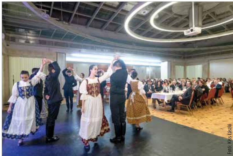
Az Ikarus Táncgyűttes adta meg a pedagógus bált alaphangját