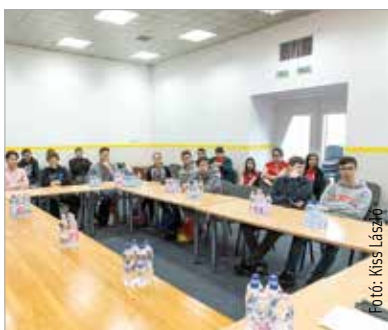
A fiatalok egy kerekasztal beszélgetés keretében ismerkedhettek a nonprofit szektorral

A Civilek Napja alkalmából Székesfehérvárra látogatott Szalay-Bobrovniczky Vince, a Miniszterelnökség Civil és Társadalmi Kapcsolatokért Felelős Helyettes Államtitkárság helyettes államtitkára. Az államtitkár kiemelte, hogy a kormány támogatja és segíti a helyi közösségekért tevékenykedő civil szervezeteket, egyrészt azzal, hogy évről