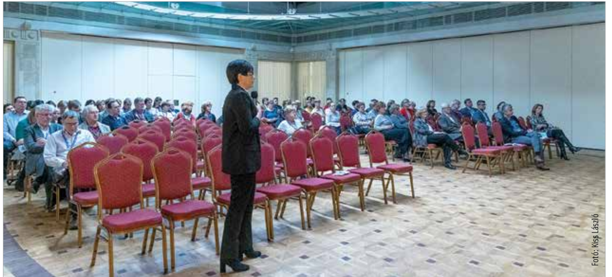
A megnyitót követően szekciós ülésekkel folytatódott a program

„Tényszerű adatokkal tudom megerősíteni azt a folyamatot, amelyről polgármester úr beszélt. A kórházfejlesztés, amelyet az utóbbi esztendőkből realizálhattunk infrastruktúrában, eszközökben a célegyeneséhez érkezett. Ezt ahhoz be kell, hogy fejezzük, hogy a kórház hosszú évtizedekre minden szempontból európai színvonalon feleljen meg a kihívásoknak” - emelte ki a tanácskozást