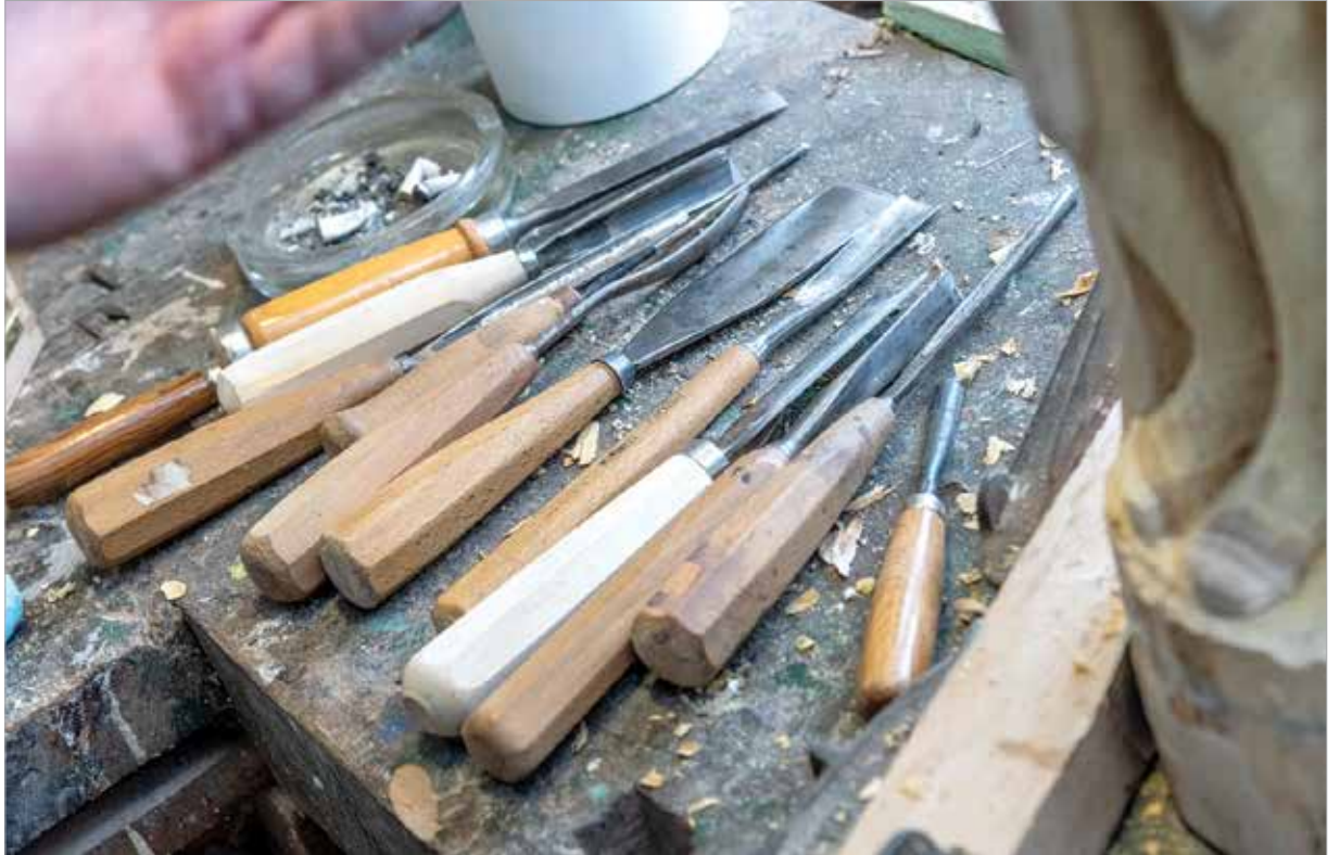
Szerszámok pihenés közben

Ehhez kellett a szükséglet piramis ismerete is, amely a legfontosabb hét szükségletet sorolja