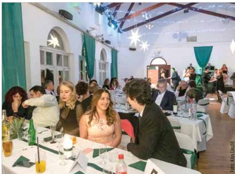
A támogatók szép estét tölthettek el a Táncházban

kal, kéréselt művészi eszközökkel meghálálja a bizalmat, s a tradicionális farsangi mulatságon pedig közösen mulassanak. A rendezők természetesen gondoskodtak arról, hogy a Vigasságcsinálók bálján, a néptánc kedvelő közönség méltó módon ünnepelhessen, nyitótáncként vérpezsdítő, fergeteges magyar táncal köszöntötték vendégeiket, majd jöhetett a multság.