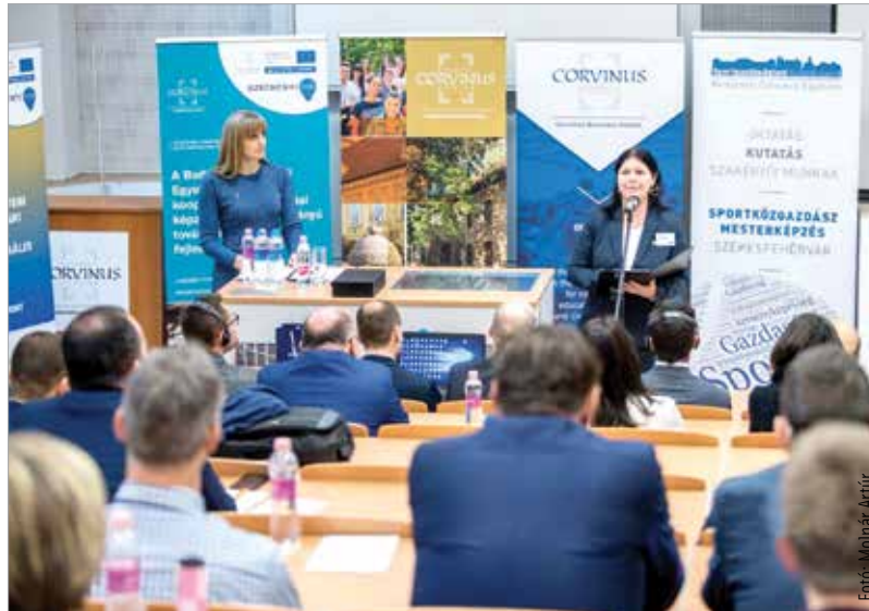
A konferencia témája a sport és a település XXI. századi kapcsolata volt

„A mai fiataloknak nyelvtudásukkal, ismereteikkel kinyílt a világ. Ők nem ez alapján fogják eldönteni, hogy hol fognak élni. Ők az alapján döntenek majd, hogy milyen életminőséget kapnak az adott helyen. Sok más mellett ehhez hozzátartozik az, hogy mit csinálnak a szabadidejükben. A sportba investált források tehát az önkor-