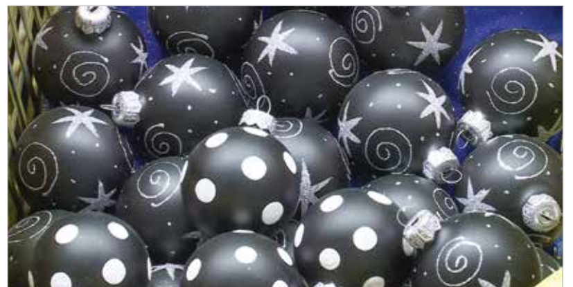
Fekete vagy fehér legyen a karácsony?