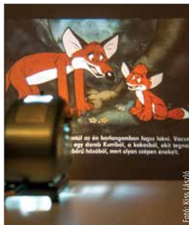
A diavetítés az egész családnak nagy élmény!

Ez a program már kellékgényesebb, viszont egyértelműen