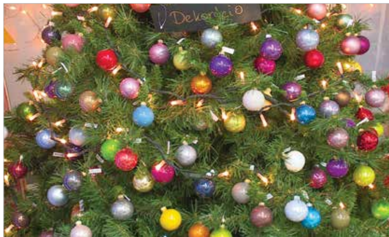
A sokszínű is lehet harmonikus!