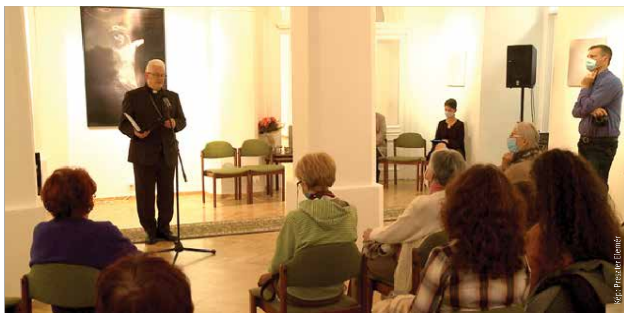
A tárlat november huszonegyedikéig látogatható a Szent Korona Galériában

„A tematikát itt a gyerekkarcok határozták meg, aminek az eredete egy csoportkép, annak a részleteit használtam fel. Az anyagot egészé a Jézus-torzó teszi. De Kosztolányi idézete is szerves része és fontos egysége az Isten gyermekei címet viselő tárlatnak. A gyerekkarcok mintha távolról kerülőnének kontextusba az emberrel. Olyan, mintha mondanak akarnának valamit nekünk. A gyermekek éneke a legtisztábban a földön, Jézushoz ezért ők kötődnek leginkább.” – fogalmazott az idén hetvenesztendő alkotó.