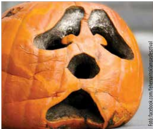
A rendezők remélik, hogy jövőre újra találkozhatnak a fehérvári töklámpáskészítőkkel

„Jó szívvel nem rendezhetjük meg úgy a szokásos éves tökszemlét, hogy nem tudjuk garantálni a tökfáragók és a nézelődők egészségügyi biztonságát. Az egyetlen megoldás, ha idén kihagyjuk, de jövőre találkozunk veletek és minden jóképű tökfajjal!” – áll a rendezvény közösségi oldalán lévő bejegyzésben.