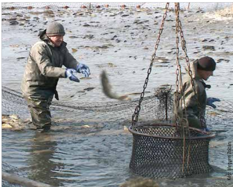
Az idén a mennyiség és a minőség is kiváló

Arról is olvashattunk, hogy egyre nagyobb problémát okoznak a kormoránok a halgazdaságokban. Ekkora tömegben, mint az idén, már négy-öt éve nem jelentkeztek