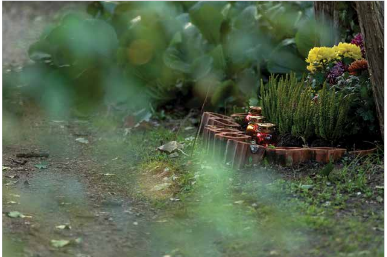
Akkor dolgoztuk fel a veszteséget, amikor képesek vagyunk elfogadni azt

Miután megtörténik a haláleset, az egyénnek nagyon sok dolga és feladata van: közölni a távolabbi ismerősökkel, temetést intézni, virágot választani, szertartást kérni vagy halottbúcsúztatót rendelni, időpontot foglalni a temetésre. Mindeközben nagyon sokan érdeklődnek a halálról, régebbi ismerősök is sűrűbben hívják fel telefonon. Majd a temetés napja után szinte mindenki elfelejti őt. Nem akarják zavarni, mondják az ismerősök. Ehhez képest a gyászolókat pont a hirtelen jött megannyi veszí körül.