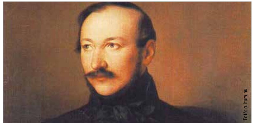
A díjazottak oklevélben és könyvjutalomban részesülnek. A díjak átadására a járványhelyzet függvényében a jövő év januárjában kerül sor.

hály élete és költészete rajzokban, melyek lehetnek grafikák, tus- és szénrajzok, pasztellek, stb. Méretük egységes: A/4-es rajzlap. Minden résztvevő maximum három pályamunkával szerepelhet, csoportos munkákat is elfogadnak. Beküldési határidő: 2020. december 1. Cím: Vörösmarty Társaság, 8000 Székesfehérvár, Kossuth u. 14.