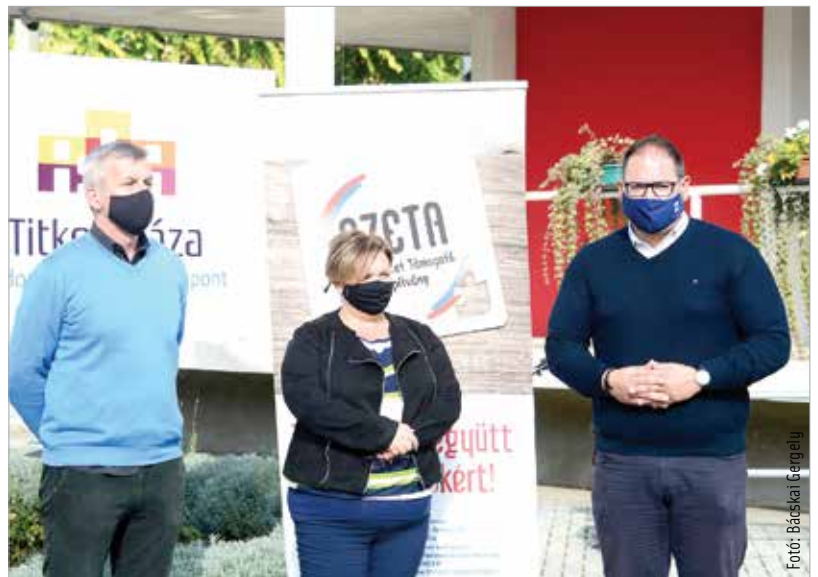
Új játékokat és tartós élelmiszercsomagokat várnak a szervezők, amiket a Hunter Cafe & Restaurantban és a Chameleon Ételbarban valamint a Gáz utcai kulcsmásolóban lehet leadni. Az ajándékokat a Szegényeket Támogató Alapítvány egy ünnepség keretében adja át a rászorulóknak.

hogy születésnapjára ne ajándékot vegyenek, hanem a menhelyen élő állatokat támogassák. Ezt gondolták aztán tovább, és focitornákat kezdtek el rendezni, ahol különböző sportrelikviákat árvereztek el és adományokat is gyűjtöttek – ezzel rászoruló családokat támogattak. Az első Adni Jó kupát kilenc éve szervezték meg. Mészáros Attila alpolgármester a civilkezdeményezés fontosságát hangsúlyozta – mint fogalmazott, nagyon örül annak, hogy az adománygyűjtés nem marad el.