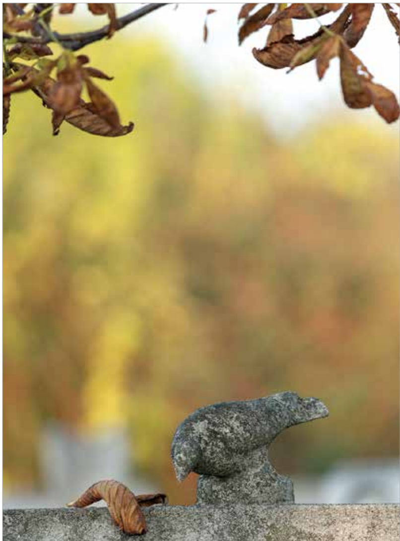
A valósághoz hozzátartozik az elmúlás

Sokféle nehezítő tényező előfordul, nem lehet csak egy-két választ adni. Többször felmerül például a lelkiismeret-furdalás, aminek különböző kiváltó okai lehetnek. Utólag bánkodom amiatt, hogy nem látogattam az elhunyt hozzátartozót vagy barátot olyan sokszor, mint ahogy kellett volna, nem figyeltem rá kellőképpen vagy nem vittem el másik orvoshoz is diagnózisra, kiabáltam vele, és így tovább.