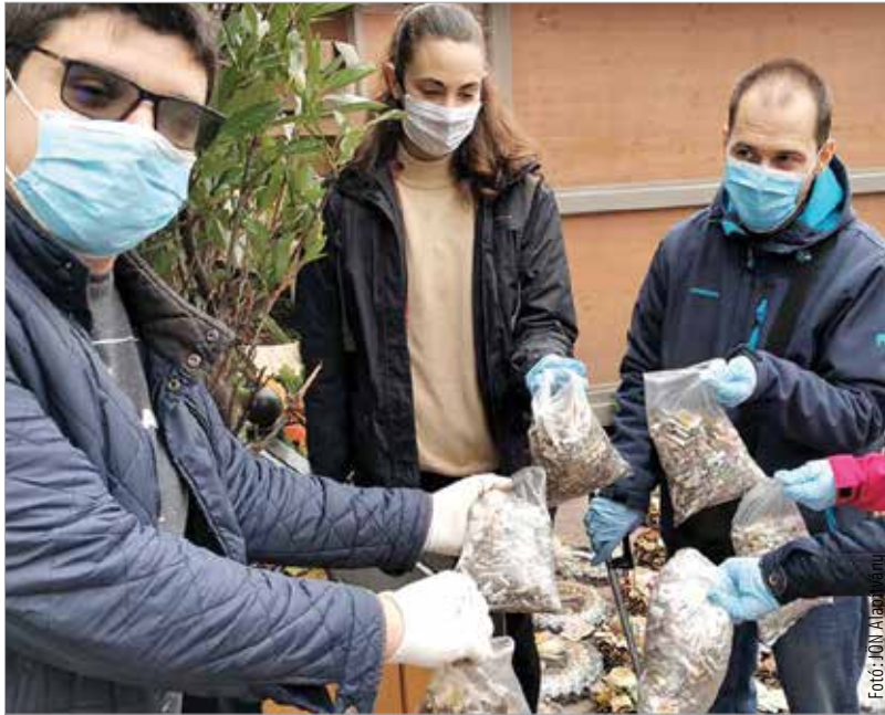
Önkéntesek szedték a csikkeket a pláza körül

tással kezdődött, amiben helyett kapott a koronavírus-járvány által előírt szabályok ismertetése is. A csikkmentes egytucatnyi önkéntes jelent meg, akik közel két órán át szedték a pláza mellett, a Várfal parkban és a buszállomás területén eldobált cigicsikkeket – számolt be honlapján a hulladekvadasz.hu.