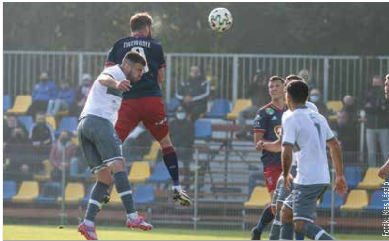
Zivzivadze fejjel és lábbal is eredményes volt a kupameccsen, de a Fradi ellen nehezebb dolga lesz

Gárdonyt győzött le, és jutott ezzel a Magyar Kupában a következő körbe a MOL Fehérvár. Szombaton pedig jöhet a bajnokság legnagyobb rangadója, hazai pályán a Ferencváros ellen!