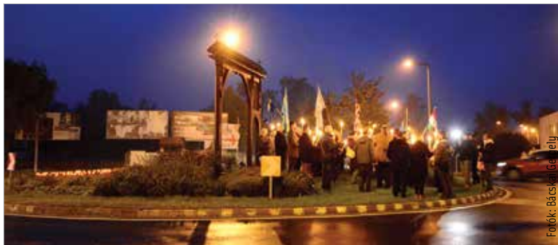
Vasárnap késő délután gyertyagyújtás volt Maroshegyen, a Balatoni úti székelykapunál, majd a résztvevők fáklákkal a kezükben átvonultak a koronás körforgalomhoz

Október utolsó vasárnapja a székely autonómia napja. A Székely Nemzeti Tanács felhívásának eleget téve Székesfehérvár is csatlakozott a székelyek önrendelkezését támogató összefogáshoz.