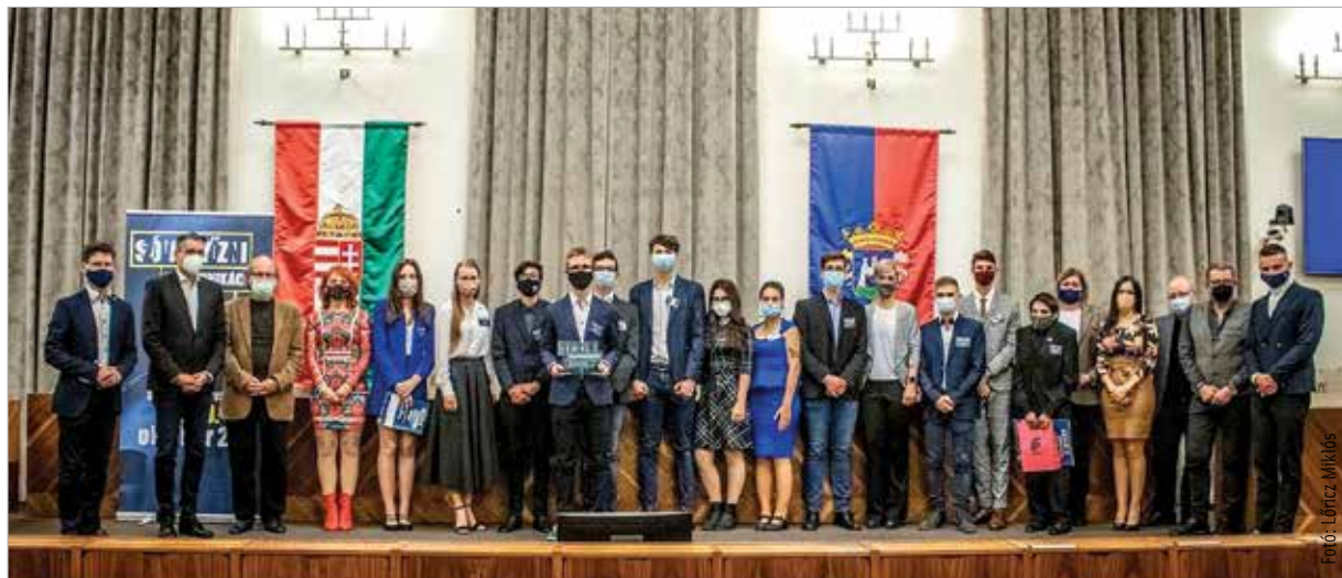
Hatvanöt diák jelentkezett a versenyre, közülük tizenketten jutottak a döntőbe

Egy háromperces beszéd, egy ötperces interjú Azurák Csabával és egy egyperces azonnali reakció egy adott társadalmi jelenséget bemutató videórészletre – ez volt a fiatalok feladata a verseny döntőjében. A fehérvári kötődésű riporter, Azurák Csaba idén is mentora, műsorvezetője volt az eseménynek, és hálásan gondol vissza a feladatra: „Nagyon boldog vagyok, amikor fiatalokkal találkozhatok és dolgozhatok együtt. Egyrészt tanulok tőlük sokat, mert már korábban messzebb vagyok a mai fiatalságtól, de nagyon jó találkozni azzal, hogy ők hogyan gondolkodnak, milyen problémák érdeklik őket és hogyan reagálnak a világ dolgaira.” Hatvanöt diák jelentkezett a versenyre, közülük tizenketten jutottak a döntőbe