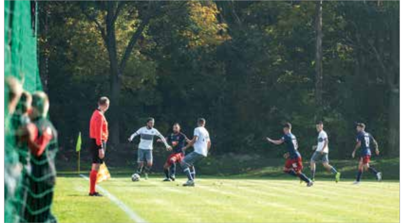
Remek idő, gyönyörű környezet, győzelem – ez volt a Vidi agárdi vendégszéké