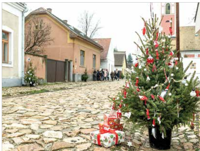
Magyarországon újra keresett a lucfenyő, az állomány azonban csökkenőben van

Kimondottan karácsonyfa-hasznosítású fenyőerdő ma Magyarországon összesen kétezer hektáron található, a legnagyobb arányban Vas, Zala és Somogy megyében.