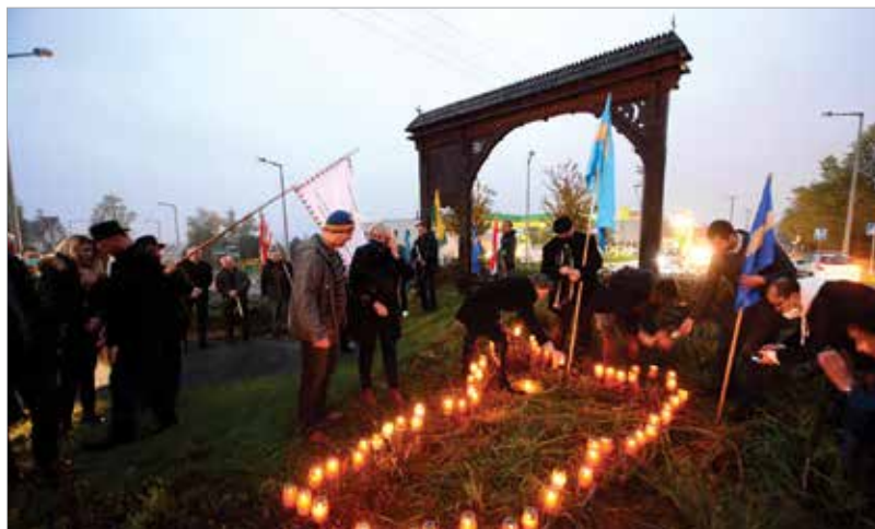
A székely autonómia napján Székelyföld-szerzte őrtüzeket gyűjtanak a hegytetőkön vagy éppen a városok, falvak központjában. Ősi szokás szerint a határvédő székelyek így jeleztek, ha támadás fenyegette a történelmi Magyarországot.