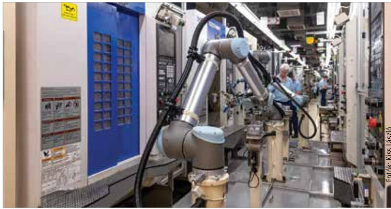
Egy robot pakolja az alkatrészeket gépből gépbe a Denso gyártósorán. A jövő már megérkezett!

A város pont a fent említett okok miatt hozta létre annak idején az Alba Innovár Digitális Élményközpontot, mely az elmúlt években már számtalan dolgozót, diákot és fiatalot vezetett be a robotika világába, képzéseik száma pedig hónapról hónapra nő.