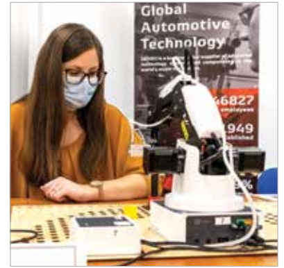
Mini robotokon tanulnak a fehérvári gyárban

Mindez pedig már nem is annyira a jövőről, egyre inkább a jelenről szól. A cégek és dolgozóik, rajtuk keresztül pedig a fehérvári gazdaság is hosszú távon megőrizheti versenyképességét az ilyen képzéseknek köszönhetően – erről már a város polgármestere, Cser-Palkovics András beszélt: „Ha az oktatás fel tudja készíteni az embert a robottal való