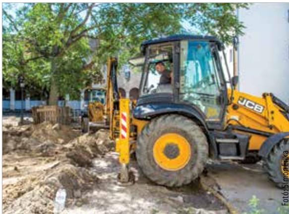
Jövőre vehetjük birtokba a megszépült Bartók Béla teret

Rövidesen igazi közösségi téré varázsolják a teret a beruházók: megkez-