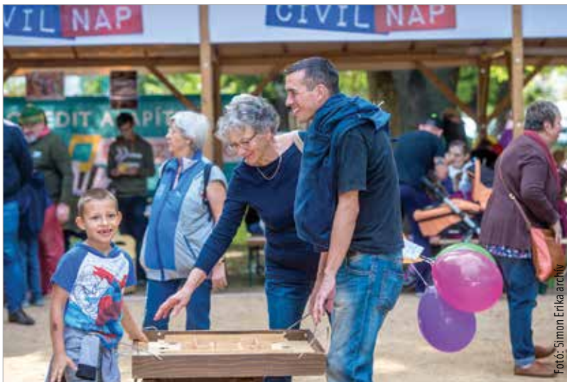
Szeptember tizenkettedikén lesz az idei Civilnap

A rendezvényt szeptember 12-én, szombaton 9 és 15 óra között a Zichy ligetben rendezik meg. A megnyitáskor közös fotó, civiltabló készül, majd 10 órától kezdődnek a színpadi bemutatkozások. Az idei évben a Civilnapon való részvétel jogosultsági feltétel lesz a székesfehérvári szervezetek működési költségeinek támogatását célzó, ősszel kiírásra kerülő önkormányzati pályázatnál. Jelentkezni augusztus 17-én, hétfőn 12 óráig lehet. A kérelmet papíron, zárt borítékban, hivatali időben lehet személyesen benyújtani a Polgármesteri Hivatal Kulturális, Stratégiai és Civilkapcsolatok Főosztályán.