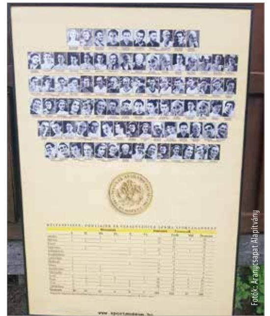
Az olimpiák történetének arany lapjaira kívánczik 1952.

Megnéztük, hogy hol lehetne elhelyezni az emlékművet, mert szándékaink szerint Melocco Miklós szobrász helyet kaphat minden olimpiaként neve, aki érmet szerzett, és az edzőik illetve a szövetségi kapitányok nevének is ott a helye. Időközben Orbán Viktor miniszterelnök úrnak is megküldtük a tervet, aki szintén