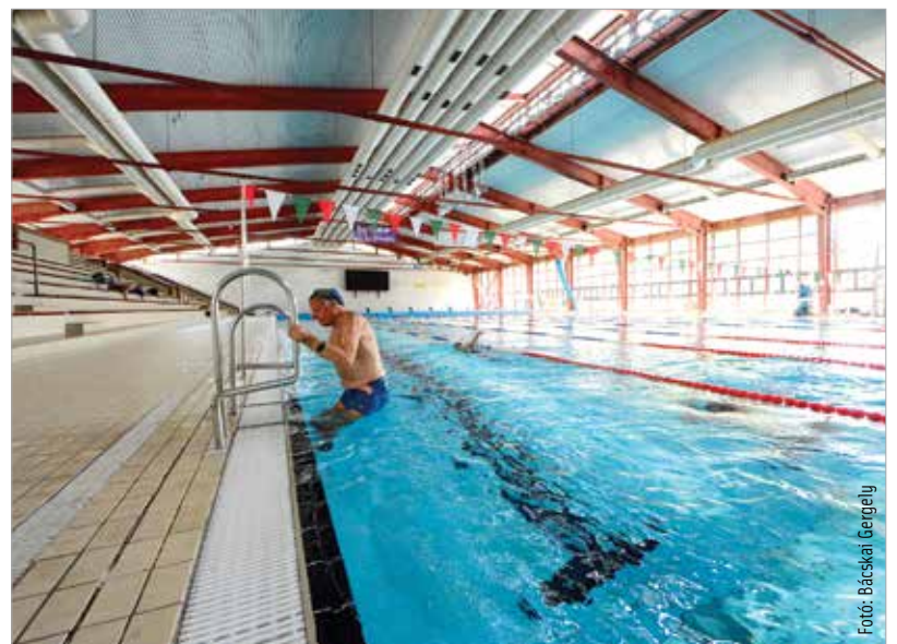
A medencékben minden feltétel adott a biztonságos úszáshoz, edzéshez

A medencékben minden feltétel adott a biztonságos úszáshoz, edzéshez. Különböző adalékanyagok, vírusölők lehetővé teszik a biztonságos használatot. Folyamatosan ellenőrzik a víz minőségét, a felületeket rendszeresen fertőtlenítik. Az uszoda pénztáránál érintésmentes kézfertőtlenítőt helyeztek ki, itt kötelező a másfél méteres védőtávolság betartása. A létesítménybe a sportolók is visszatérhettek, az uszodát rendszeresen igénybe vevő nyolc fehérvári sportegyesület is tart már edzéseket.