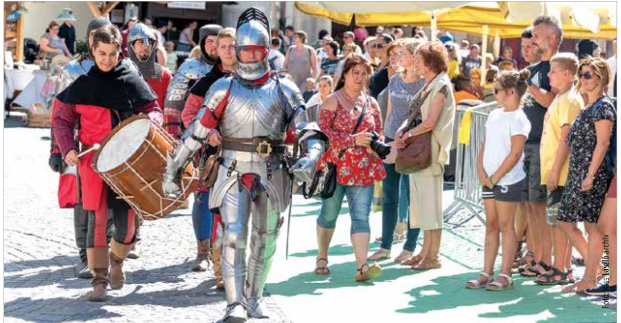
Idén augusztusban is megelenevedik a középkor a belvárosban, és az óriásbábokkal is lehet majd találkozni

Augusztus harmadikán, hétfőn este a polgármester közzétette, hogy az Operatív Törzs ajánlása