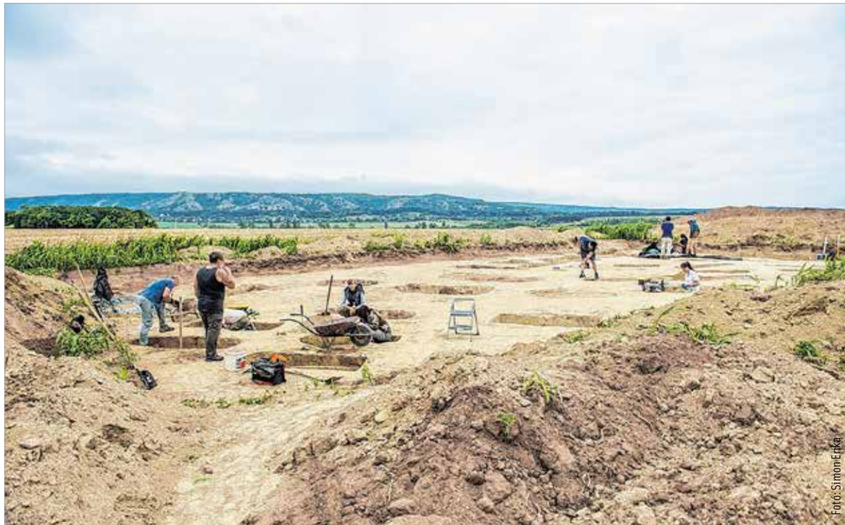
A feltáráson augusztus nyolcadikáig dolgoznak a régészek és az önkéntesek