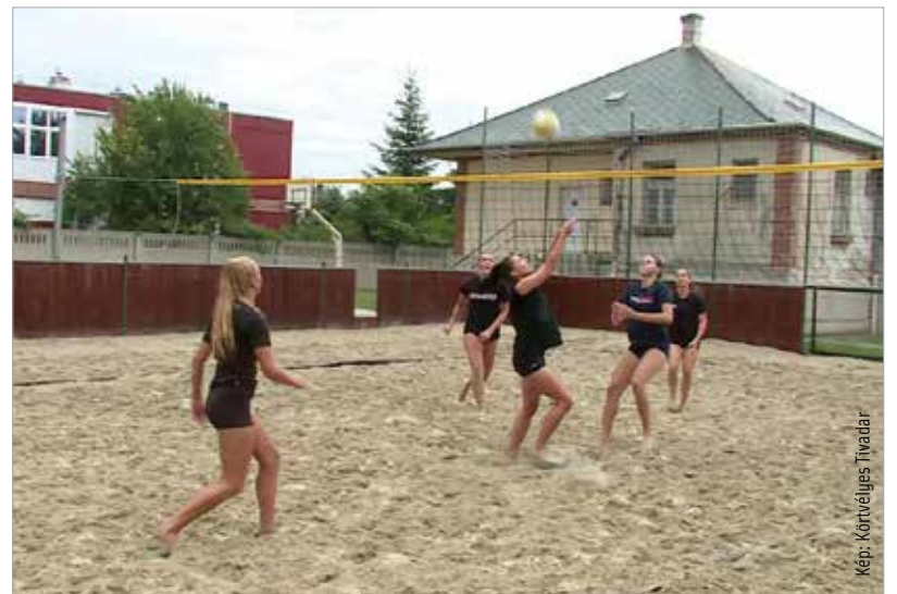
Strandröplabdával hangoltak a lányok a teremszezonra

A csapat szeptember 26-án itthon kezd a bajnokságot a Debrecen ellen.