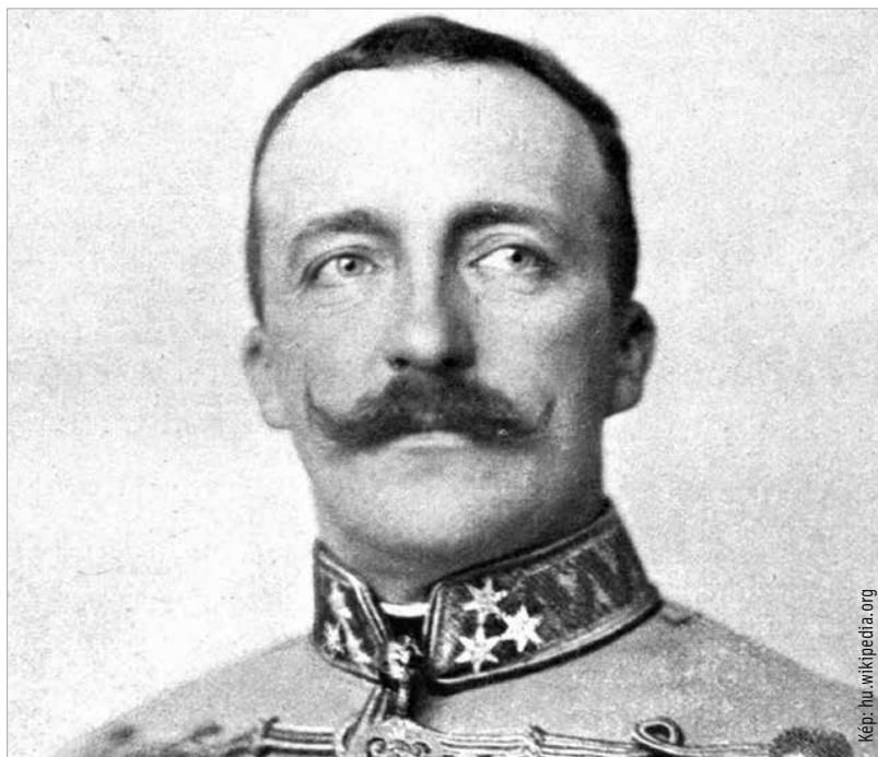
A Habsburgok Palatínus-ágáról származó Habsburg-Lotharingiai József Ágost főherceg második volt fiúként követte apját, József Károly példáját, és katonai karriert épített

vált küzdelemnek béketárgyalások útján véget vessen. Kiáltványa szerint mindent meg kíván tenni azért, hogy „újból megszerezze népeinek a béke áldásait, biztosítsa a monarchia fennállását”. Hívei bekecsászárnak, ellenfelei árulónak minősítették.