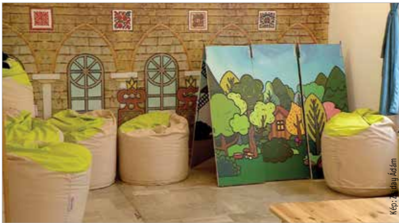
A Népmesepont újra várja a gyermekeket!

Jó hír, hogy a Népmesepont az eredetileg hároméves projekt lezárulását követően is várja a látogatókat a művelődési ház fenntartásában. Az intézményben az elmúlt időszakban is folyamatosan ellátták a közművelődés-szervezői feladatokat, megannyi online tartalommal gazdagították kínálatukat. A kreatív online foglalkozások folytatódhatnak, míg a Népmesepont a május tizenhetedikéi, hétfői nyitás után részben online üzemmódra állt át. A későbbiekben előadásokkal készülnek a gyerekeknek, illetve műhelyfoglalkozást szerveznek a pedagógusoknak.