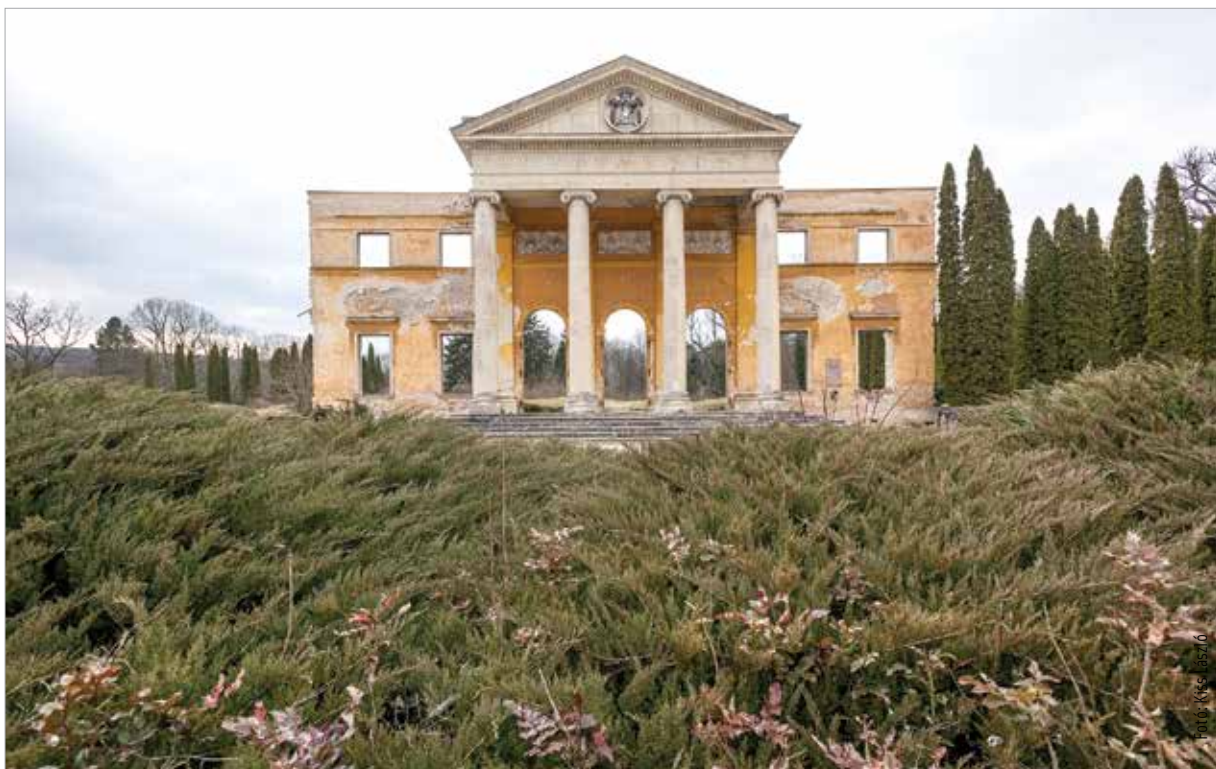
A főherceg egykori alcsúti birtoka a romos kastélyhomlokzattal

József Ágost főherceg visszavonult alcsúti birtokára. Bekövetkezett, amitől rettegetek: az orosz minta és az elégedetlen, nyomorgó tömegek találkoztak. József Ágost főherceget Alcsúton érte a Tanácsköztársaság megalakulásának híre. Kastélyába befészkelte magát a Direktórium, fiát, József Ferencet tűszként a budapesti Gyűjtőfogházba szállították, őt magát favágóként alkalmazták saját birtokán. 1919 augusztusában aztán véget ért a rémálmom. A Tanácsköztársaság bukása után a fővárosba sietett, és rövid három hétre puccszerűen magához ragadta a kormányzói hatalmat. Úgy vélte, hogy az uralkodótól kapott felhatalmazás örök érvényű, vagy legalábbis visszavonásig érvényes, az pedig nem történt meg. Ezért természetesnek tartotta, hogy a kormányzói jog őt illeti meg. József Ágost főherceg kifogásta-