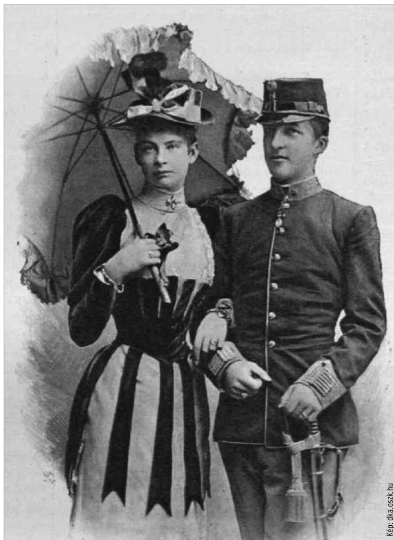
Augusztai bajor királyi főhercegnő és József Ágost főherceg

Akarva-akaratlanul előidézte az első világháborút. Az akkor nyolcvanhárom éves Ferenc József császár gyors lefolyású megtorlást ígérve belevitte a monarchiát egy öngyilkos háborúba. A hadügyminisztérium által összeállított háborús veszteséglistán a monarchia által mozgósított katonák közül 381 ezren vesztették életüket, 743 ezren sebesültek meg, 400 ezren eltűntek, 615 ezren hadifoglyokká váltak. Ez összességében 2 millió 139 ezer fő. Ebből Magyarország vesztesége 661 ezer fő volt. A magyar férfiveszteség hozzávetőlegesen három mai Debrecen, illetve majdnem hét Székesfehérvár lakosságának számával egyező. Ehhez jönnek még az egyedül maradt özvegyek és árván maradt gyerekek. És a végtelen nyomor. A kettős gyilkos, Gavrilo Princip büntetéséért bevonult egy csehországi börtönbe, Terezínbe, ahol a rácsok nyújtotta védelmet és a teljes ellátást élvezve ágyban, párnák közt hunyt el négy év múlva, 1918. április 28-án tüdőbajban, mellyel már zsenge kora óta küzdött. Az agg Ferenc József császár 1916 nyarán már érezte, hogy birodalma összeroppan, ha a következő év tavaszára nem fejezi be a háborút, amit a „mire a fák levelei lehullanak” időpontra ígért két évvel azelőtt. A befejezés mikéntjét illetően valószínűleg győztes, dicsőséges fináléra gondolt. 1916. november 21-én azonban a császár – szintén ágyban, párnák között – elhunyt. Az őt követő, fiatal IV. Károly vállalta magára a hálátlan feladatot, hogy a kilátástalanná