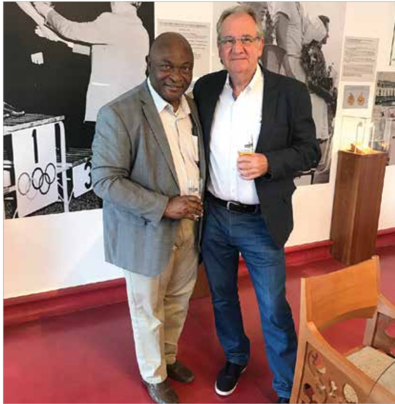
A szakmai találkozók ma is megerősítést jelentenek

A főhajtás és a köszönet a sok gyógyulttól természetes, ugyanakkor nagyon fontos, hogy azt az utat, amely a gyógyuláshoz vezetett, az új eredményekkel együtt megismerjük mások is. Ezt viszont publikálni kell, amiben szintén élen jár. Mennyire fontos ez az orvostársadalom számára itthon és külföldön?