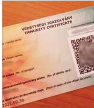
A védettségi igazolvány azonban továbbra is fontos, hiszen az újranyitó intézményekbe egyelőre ez jelenti a belépőt!

A Magyar Hírlap úgy tudja, hogy az applikáció a postai úton küldött kártyákhoz képest több információt mutat majd a regisztrálást követően. Szerepelni fog rajta, hogy az alkalmazás használója mikor kapta meg a vakcinát, valamint az első és a második oltás időpontja is látható lesz. Ez pedig fontos lehet bizonyos országoknál, ahol a beutazás feltétele a teljes védettség, amely a legtöbb oltóanyag esetében két dózis után számítható. A második oltás után az applikációban frissülni fognak az adatok. A Magyar Hírlap információi szerint az alkalmazás emellett mutatni fogja a kapott vakcina típusát is.