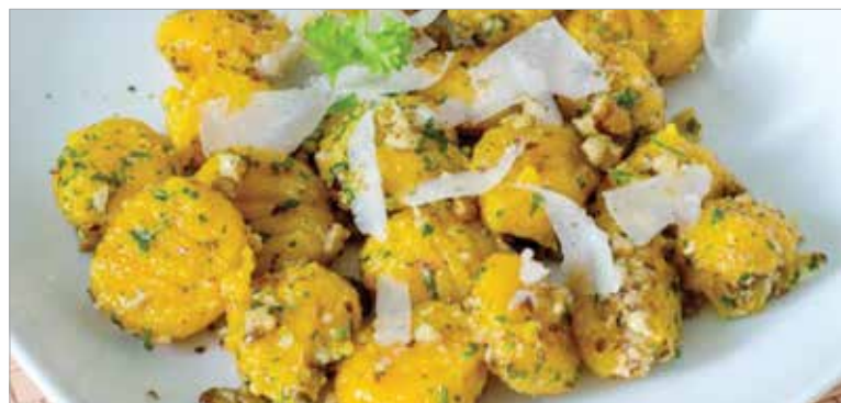
Finom és egészséges!

Forraljunk vizet egy fazékban, s lobogó, forró vízben főzzük a tésztát két-három percig! Miután leszűrtük, egy tapadásmentes serpenyőben forrósítsunk fel egy kis vajat, futtassuk meg rajta a gnocchit, majd szórjuk meg aprított petrezselyemmel, forgassuk össze, és jöhet rá a parmezánforgács!