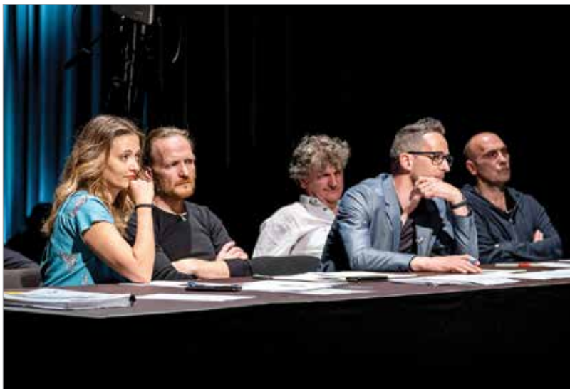
Munkában a zsűri

hogyan megtalálják a musical szereplőit: „Nagyon élvezetes a válogató, mert az egy nagyon nehéz műfaj, amikor valakinek tíz-tizenöt perc alatt kell megmutatnia magát. Ennyi idő alatt persze nem derülhet ki, hogy valaki tehetséges vagy sem, ezért egy ilyen rövid, stresszes meghallgatás nem feltétlenül alkalmas arra, hogy az ember mélyen megmértesse, de hát