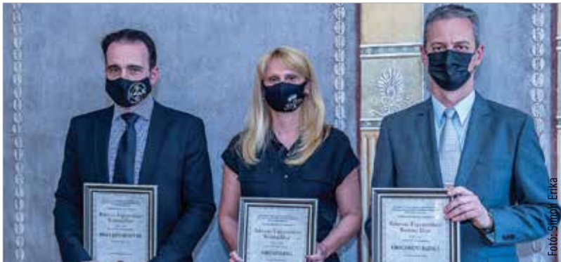
Idén immár hetedik alkalommal adták át a Fehérvári Fogyasztókért szakmai díjat. Gyártás kategóriában a Tortapalota, szolgáltatás kategóriában az Öreghegyi Patika, kereskedelem kategóriában pedig a Pinke Szívárvány Bt. érdemelte ki az elismerést. F. Sz.