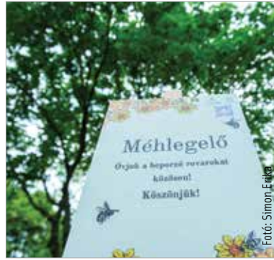
Az úgynevezett méhlegelő a városba hozza vissza a természetes életközösséget – ezt jelzi a tábla is