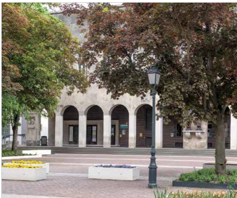
A megújult Bartók Béla téren számos színházi előadást láthatunk majd a nyáron

Moziba menni jelenleg az érvényben lévő járványügyi szabályok szerint lehet. Így a Barátság mozit kizárólag a koronavírus ellen védett személy, valamint a felügyelete alatt lévő, tizennyolcadik életévét be nem töltött személy látogathatja. A belépéskor itt is szükség lesz a védettségi igazolványra és személyazonosító igazolványra.