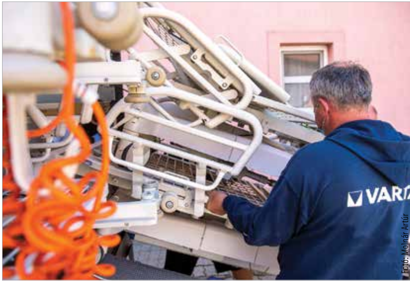
Éz a típus a legkorszerűbbek közé tartozik: infúziós állvánnyal és akkumulátorral is ellátott, teljes felszereltségű eszközről van szó

Az elektromos kórházi ágyak teljes felszereltségűek, infúziós állvánnyal és akkumulátorral is el vannak látva, illetve guríthatók. Elektromosan lehet emelni a magasságot, felültetni a benne fekvő személyt, fotelszerű testhelyzetbe állítani, lábat emelni. A korszerű, ergonomikus kialakítású, magas fokú higiéniai előírások betartásával fejlesztett ápolási eszköz komfortos az ellátottak számára, és jelentősen megkönnyíti az ápoló-személyzet munkáját.