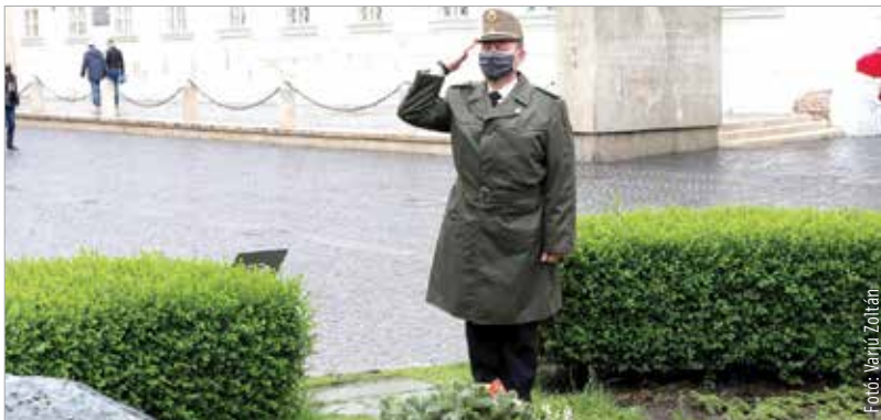
A második világháború európai befejezésére a város több pontján emlékezett Székesfehérvár és Fejér megye önkormányzata. A világégés mintegy hatvankétfélmillió ember életét követelte.