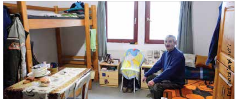
A Kríziskezelő Központban otthonos körülményeket biztosítanak az ellátottaknak

nak. Ugyancsak kap pénzt a központ lakókonténerek és egy szaniterkonténer bérleti díjára, tisztítására, fertőtlenítésére, bontására és elszállítására. A konténereket tavaly decemberben, a város finanszírozásával kapta meg az intézmény, hogy biztosítani tudja az utcáról újonnan bekerülők elkülönítését a járványidőszakban. Most ezen költségek fedezetére kap az intézmény egymillió forintot. Emellett felújítják a Sörház téri éjjeli menedékhelyt és átmeneti szállót is. Zsabka Attila hozzátette: az utóbbi időben az egyik legfontosabb feladatuk volt, hogy a járvány idején is folyamatos legyen a szakmai munka. A koronavírus elleni védőoltás beadatására is ösztönözték ellátottjait: a hajléktalanok közül száznegyvennyegen kapták meg a vakcinát.