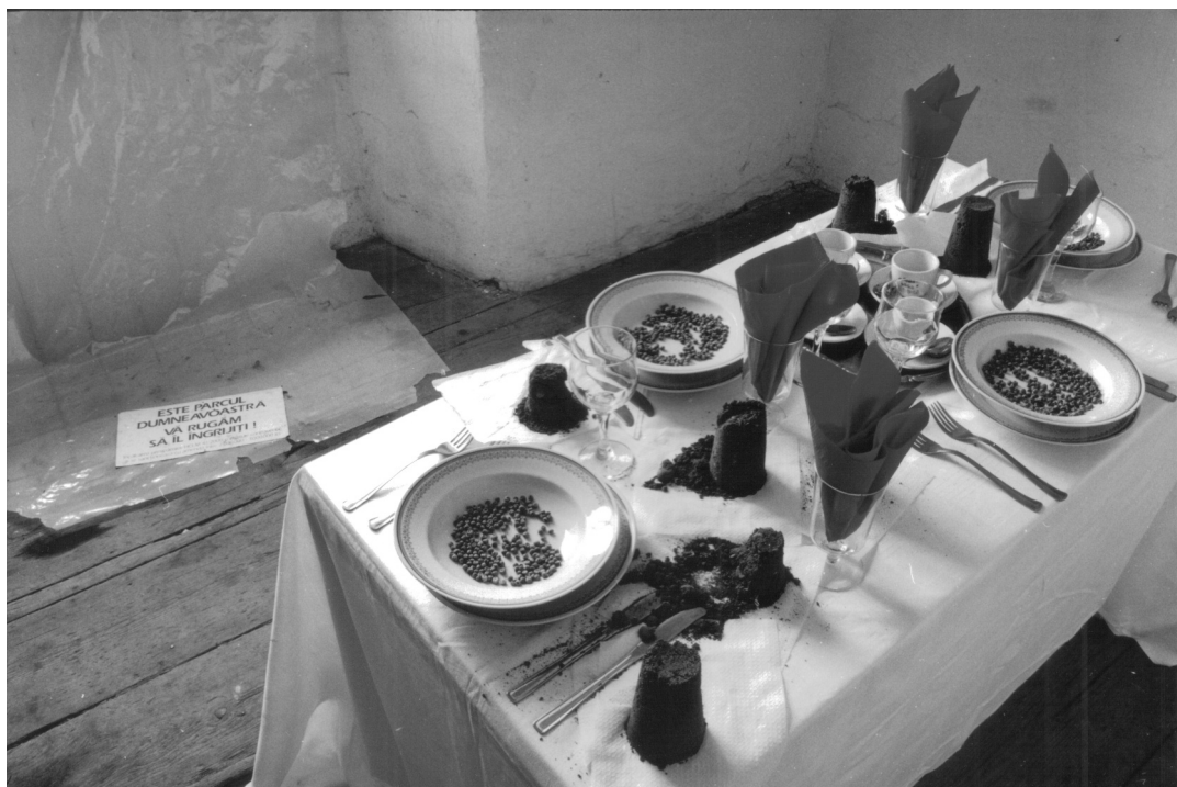
Anna elablása , installáció, 2003