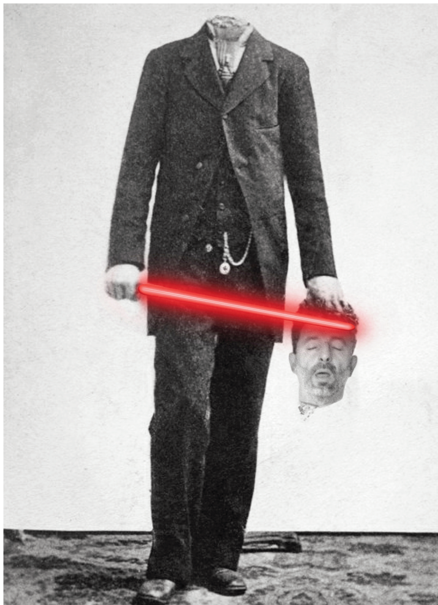
Az utolsó önarckép. Digitális grafika, 2013

A regény queer olvasatának érzékeltetése nem lenne teljes, ha kihagynánk a felsorolásból azokat a szereplőket, akik meghatározó módon végig jelen vannak a főszereplő