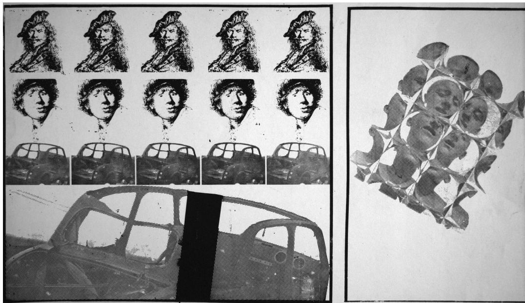
cím nélkül , 50x70 cm, szitanyomat, 1974

az embereket az igazság mellett, nagyon kedvelt elemmé vált. De már kiütözik némileg Miller Batman-centrikus hozzáállása, ami a másik megjelenő szuperhős, Superman degradálását is jelenti, amit azzal ér el, hogy a politika kutyájává teszi őt. Ez már elég előnytelenül és dühítően hat a The Dark Knight Strikes Again sorozatban, és az All Star Batman and Robin sorozatokban, ami Frank Miller agyament elképzeléseivel van tele. A nőkhöz való viszonya pedig leginkább az Első év eredettörténetben látszik, ahol véleményem szerint meggyalázza Macskanő személyét.