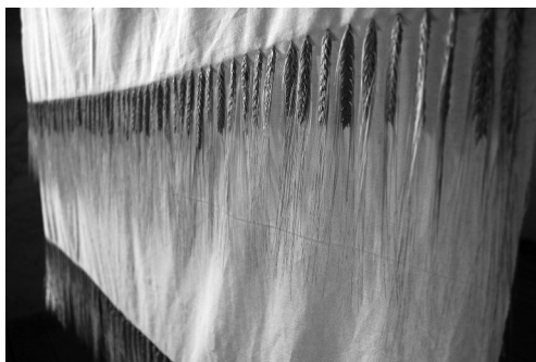
Élet , installáció, térbeavatkozás, Olaszteleki Dániel Kastély, 2014