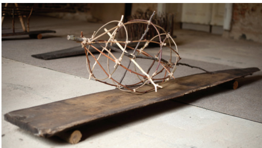
Ferdics Béla: Csapda XIV. , 2019, tölgyfa, faág, madzag

Ha megáldjuk az időt, az idő is megáld minket.