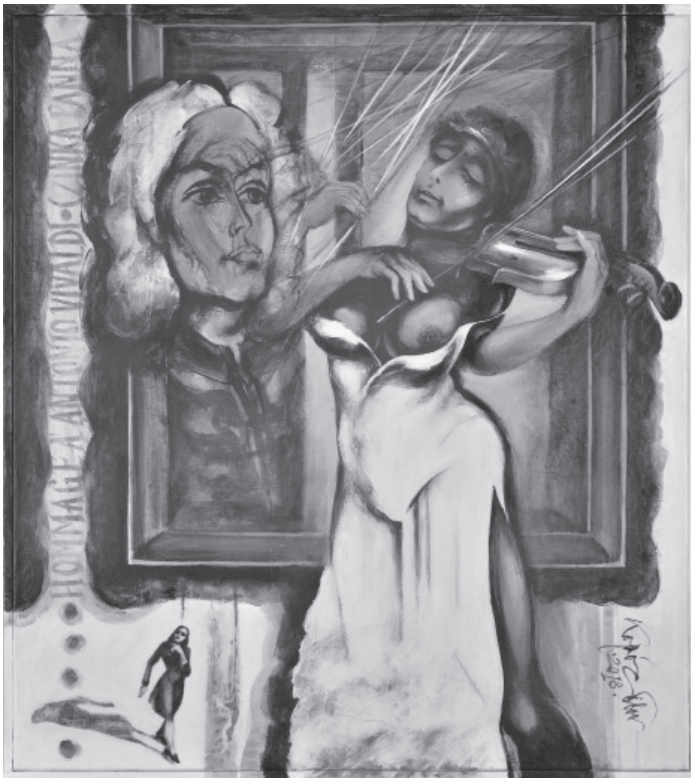
Kopócs Tibor: Hommage á Antonio Vivaldi – Czinka Panna , akril, 2018

Úgy gondolom, drága Beni, hogy ez egy gyönyörű barátság kezdete!