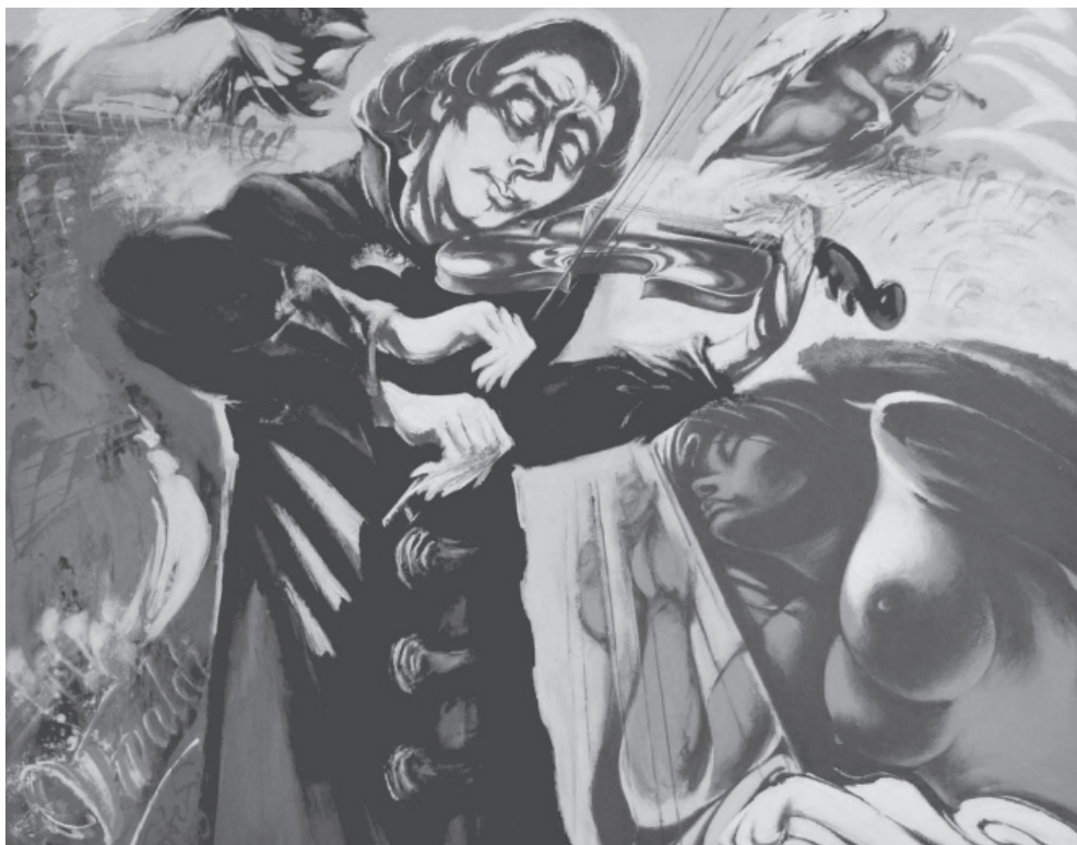
Kópocs Tibor: Antonio Vivaldi: Tavasz , akril, 2019

Lopakodó alkonyat kopogtat ablakomon, idegen madarak a cseresznyefámra szállnak. Csivitelésük elhalkul, visszafogott, talán fáznak. Nincs csapongó tánc, nincs kedves ének. Bámulója vagyok csak ennek az egésznek. A megdermedt hangokat fölfalja a jéggyöngyöket csörgető február. A madarak elrepülnek, velük a remény is tovaszáll.