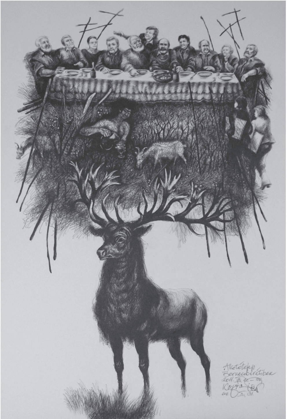
Kopócs Tibor: Bernecebaráti (utolsó) Vacsora , golyóstoll, 2011