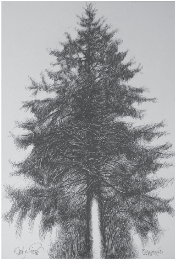
Kopócs Tibor: A fenyő , golyóstollrajz, 2011