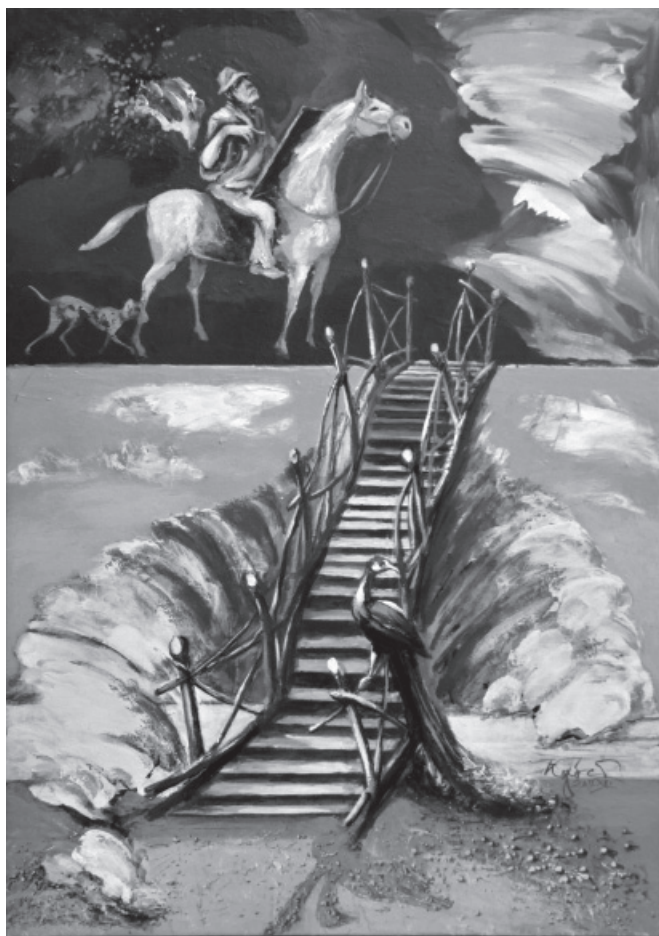
Kópócs Tibor: A Mester lóháton , akril, 2011

Nélküle nincs múlt és nincs jelen – és nincs jövő!