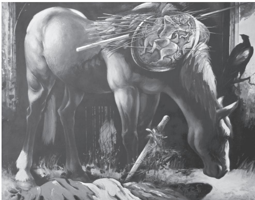
Kópocs Tibor: A Ló (Bulcsú horka emlékére) , akril, 2012–14

Az ember néha érthetetlen dolgok tanúja. Vannak szívek, amelyek a távolból is hallják egymás dobogását, de azt is, amikor életük kis motorja örökre megáll. Csak így lehet, hogy a két pontnak meg kellett jelennie a térképen, mert így akarta ezt egy halott, aki ott hevert egy erdei tisztáson, s akinek szelleme erősebb volt, szerelme pedig állhatatosabb, mint az életet a haláltól elválasztó mérhetetlen időrengeteg.