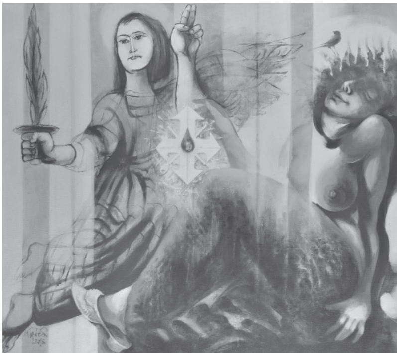
Kópocs Tibor: Az angyal érintése I. (Hommage á Szalay Lajos grafikusművész), akril, 2016

SZARKA LÁSZLÓ, Szlovák nemzeti fejlődés – magyar nemzetiségi politika 1867–1918 , Pozsony, Kalligram – A Magyar Köztársaság Kulturális Intézete.