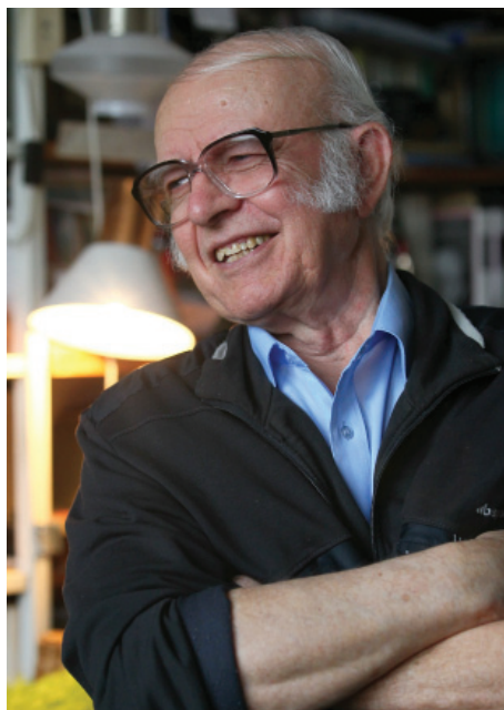
Tőzsér Árpád (1935)