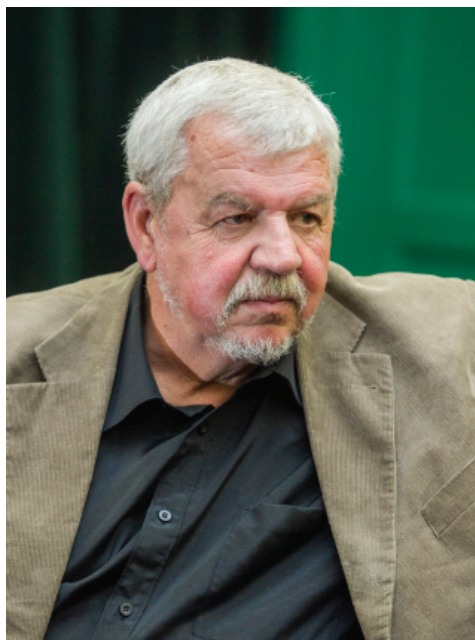
Soóky László (1952–2020)