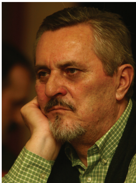
Bereck József (1945–2013)