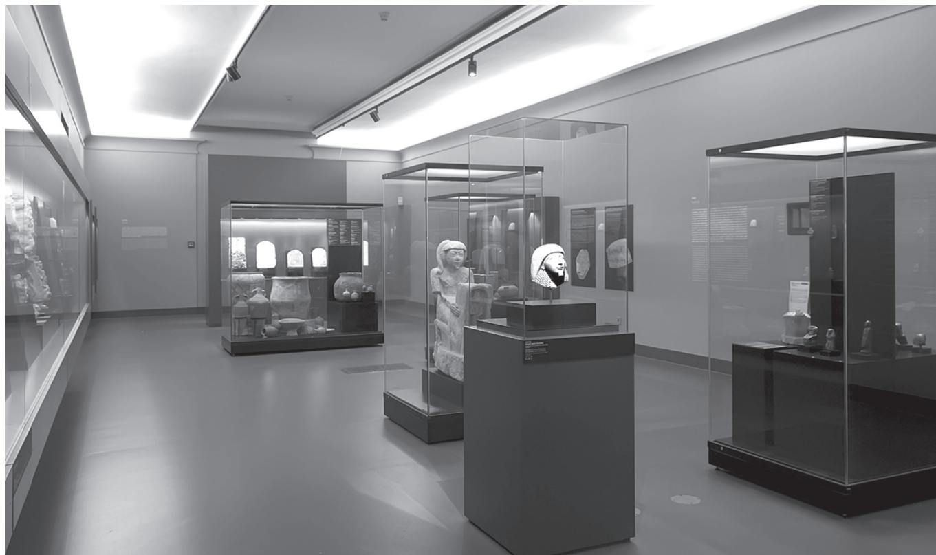
1. kép. Az emberek világának kiállítótere

Az állandó kiállítás története sok évtizedes múlttal dicsekedhet. 1939-ben nyílt meg az első tárlat, ezt követően lényeges változást az 1972-es átrendezés és bővítés jelentett. 2009-ben, a múzeumban tervezett átalakítások miatt a kiállítást lebontották, amely most, hosszú előkészületek és egészen új koncepció mentén, nagyobb területen és lendületes, új látványtervvel épülhetett újjá. Majd félezer műtárgyat tekinthetünk meg az új tárlaton, a kiállítás történetében először tematikus egységekbe rendezve. A történetiség fontos, de talán nem elengedhetetlen szempont, hiszen az évszámok, dinasztiák, korszakok súlyos adathalmaza könnyen elnyomhatja a tárgyi kultúra és az ókori egyiptomi világszemlélet megértésének egyéb fontos aspektusait. A történeti fejlődés hangsúlyozása nélkül is éppen elég új fogalommal, tárgytypussal, vallási elképzeléssel kell megismerkednie a témakörben még járatlan látogatóknak, így a kiállítás újrarendezésekor érvényesített fontos szemléletváltás tagadhatatlanul azt a célt szolgálja, hogy a látogatók minél teljesebb képet kapjanak egy ókori kultúra jellegzetes vonásairól.