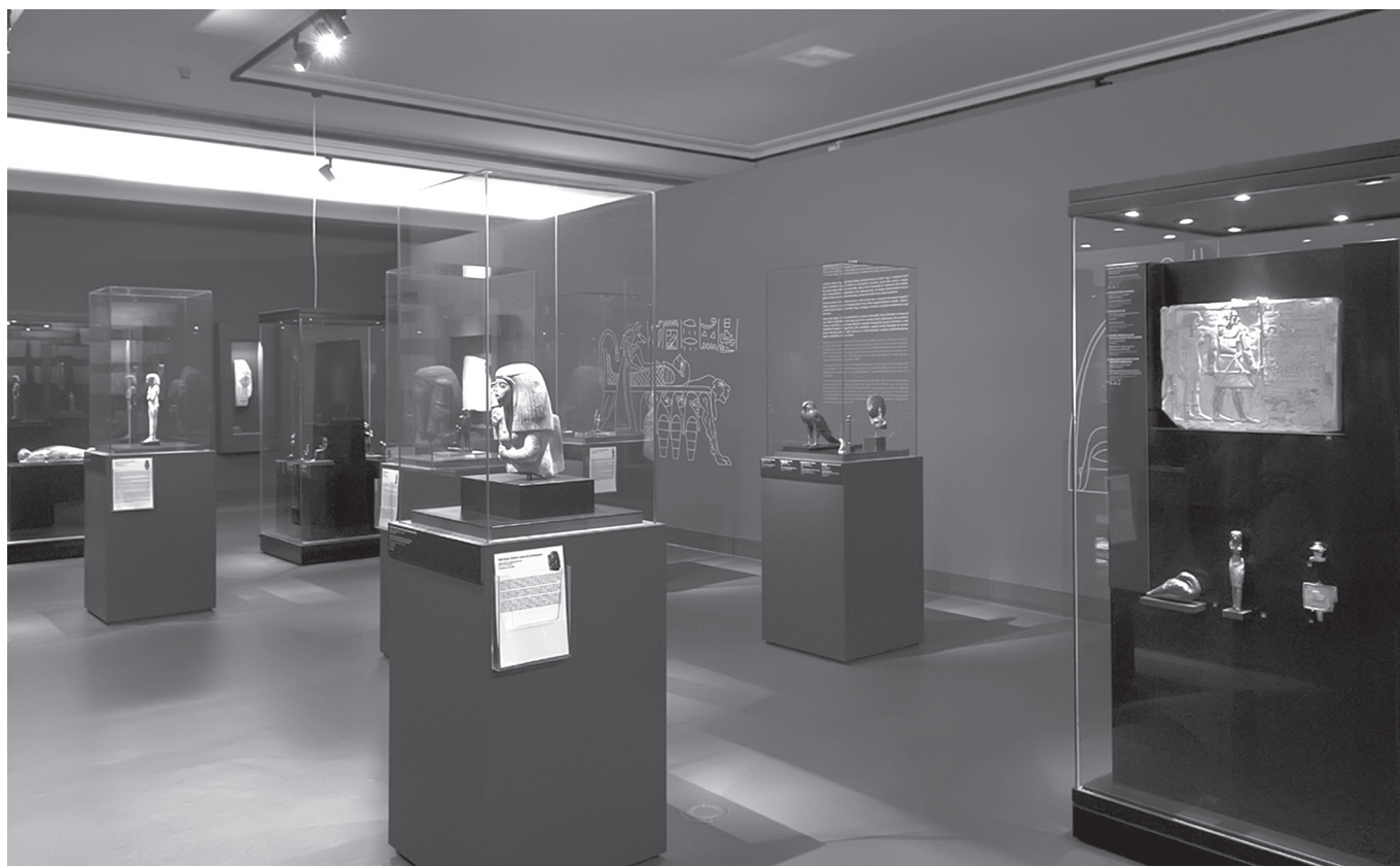
3. kép. Az istenek világának kiállítótere

Itt érdemes rátérni a tárgyakhoz tartozó magyarázó szövegek típusainak bemutatására, ezek ugyanis több szinten jelentkeznek, mind a magyarázat, mind a megjelenítés szempontjából. A szövegek minden esetben kétnyelvűek, pontosak és informatívak. Az egyes termek elején, feltűnő helyen olvashat-