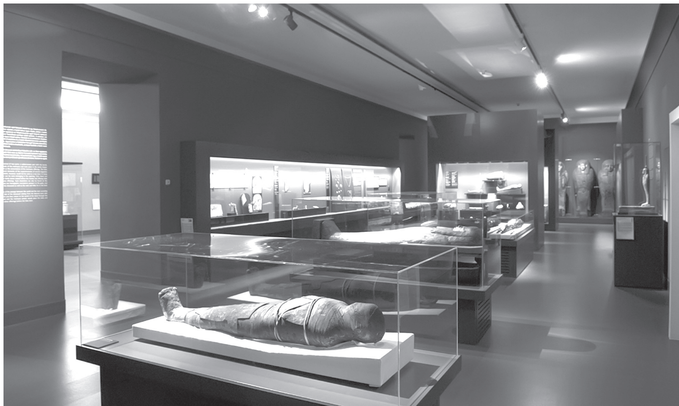
4. kép. A halottak világának kiállítótere