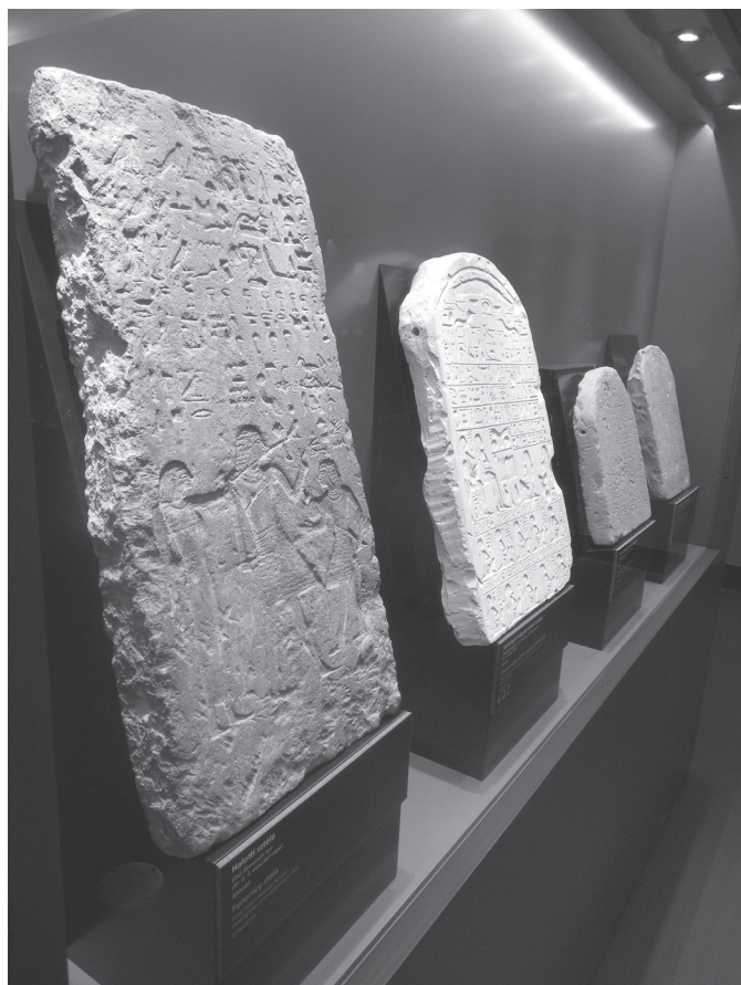
2. kép. Sztéléket bemutató vitrin

A modern, letisztult és mégis rendkívül izgalmas módon kialakított kiállítótér megtervezése és a látványterv kivitelezése a nagy gyakorlattal és tapasztalattal rendelkező Narmer Építészeti Stúdió érdeme. A bemutatott anyag mennyisége, illetve a tárgyakon keresztül megjeleníteni kívánt tartalom komplexitása ellenére a vitrinek és a falon megjelenő szövegek és rajzok együttese nem hat nyomasztóan a belépőre. Az anyag gazdagságát és sokszínűségét a szellőség megtartásával sikerült prezentálni, és ebben felbecsülhetetlen szerepe van a kiállítási design ötletes megoldásainak, a világítástechnika, a színek és tükröződések mesteri alkalmazásának és kihasználásának.