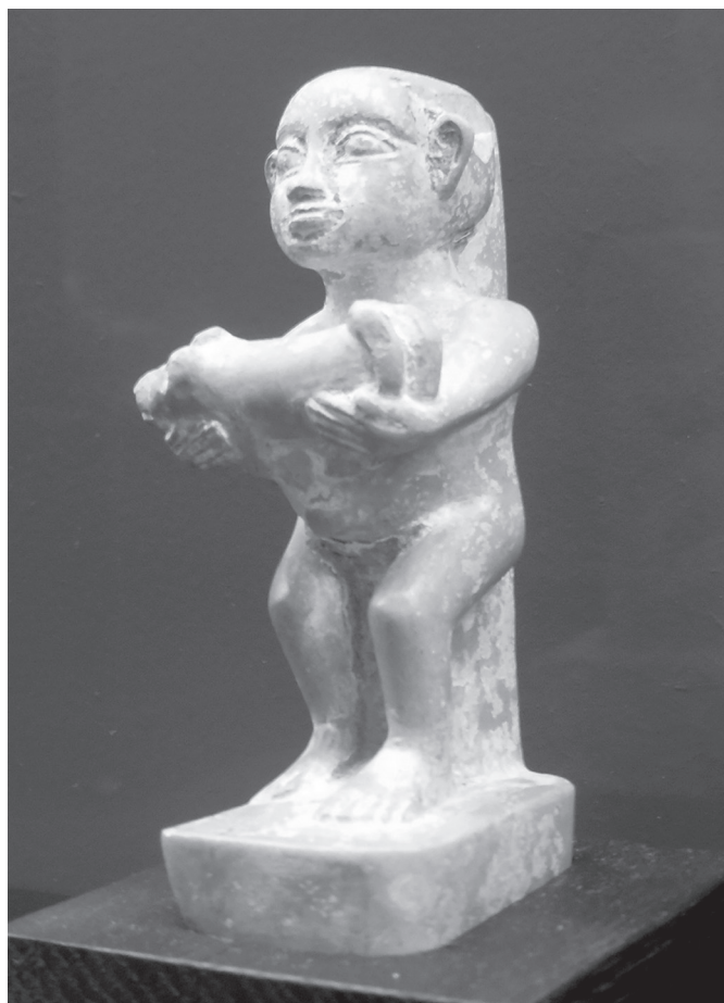
6. kép. Kutyát tartó törpe mésző szobrocskája. Középbírodalom

telmű vizuális kontrasztok feltehetően mélyebb nyomot hagynak a közönségben, mint a hosszú leírások. (Megjegyzendő, hogy a koporsók szimbolikáját, felépítését leíró, amúgy kitűnő kísérőszöveg a szarkofágok palotahomlokzat motívumát emeli ki, amelyet azonban a kiállításon egyetlen tárgy sem illusztrál.) Tematikus kiemelést kap még a teremben az egyiptomi