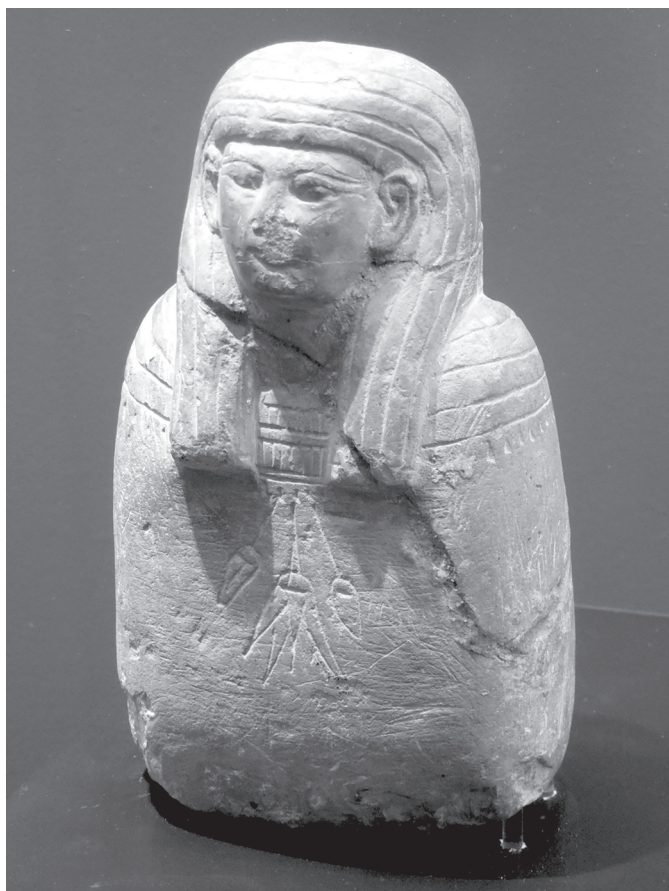
7. kép. Ösbüsz. Újbirodalom, 19. dinasztia

sírépítmény egyik legfontosabb kultikus eleme, az áljtó, az állatkultuszok, a mumifikálás során eltávolított belső szervek tárolására szolgáló kanopuszedények és az elhunyt túlvilági munkáját elvégző usébtí szobrocskák.