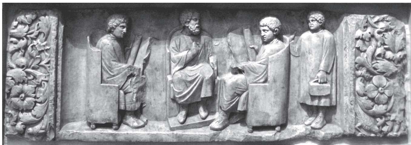
Iskolai jelenet egy római kori síremléken. Kr. u. 180 körül (Rheinisches Landesmuseum Trier)