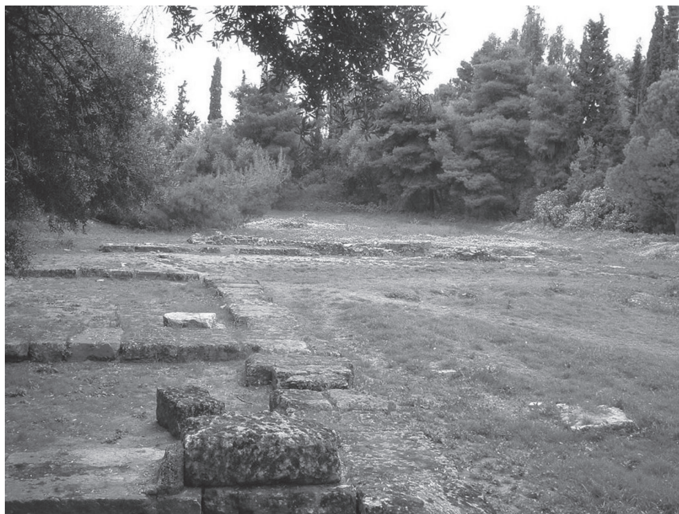
1. kép. Platón Akadémiájának feltételezett helye Athénban

További, a platóni filozófiában felfedezhető pythagoreus hatás mellett szóló érv lehet Aristotelés különvéleménye Platón filozófiai fejlődéséről. Leghíresebb tanítványa szerint Platón úgy jutott el legismertebb tanításához, a Formák tanáéhoz, hogy elfogadta mind a sókratészi nézetet, amely szerint tudásra minden esetben valamilyen univerzálé definíciójaként tehetünk szert, mind pedig a hérakleitiánus nézetet, amely szerint az érzékelhető, keletkezésnek és pusztulásnak kitett létezőkről nem lehetséges ilyen ismeretet alkotni. Aristotelés szerint Platón ezért tételezte a Formákat mint olyan létezőket, amelyek a tudás tárgyai lehetnek, s amelyekben az érzékelhető dolgok részeseznek – ez az álláspont pedig Aristotelés szemében nem különbözik a pythagoreusokétól, amelyet a Metafizikában közvetlenül ez előtt a szakasz előtt ismertet. 25