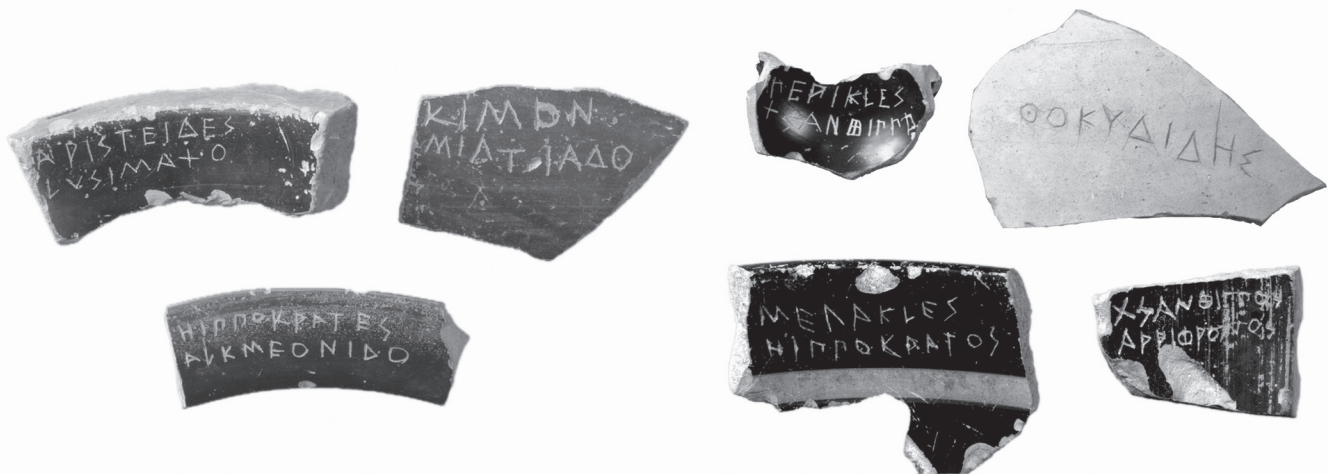
1. kép. Athéni osztrakonok a Kr. e. 5. századból

A testneveléstanárok bére a határozat értelmében havonta és személyenként harminc drachma, az írástanároké pedig havonta és személyenként negyven drachma. A szónoklataik és egyéb ügyeik költségeiről a gyermekfelügyelői törvény rendelkezik. A megszavazott testneveléstanároknak el szabad utazniuk, ha versenyzőként részt akarnak venni valamelyik koszorút adó versenyjátékon, amennyiben a gyermekfelügyelők elengedik őket, és ha olyasvalakit biztosítanak maguk helyett a gyerekek oktatására, akivel a gyermekfelügyelők is meg vannak elégedve. 20 Azért, hogy a bért mindegyikük rendszeresen megkapja, a kincstárnokok a meghatározott összeget (60) minden hónap első napján adják át a testneveléstanároknak és az írástanároknak. Ha