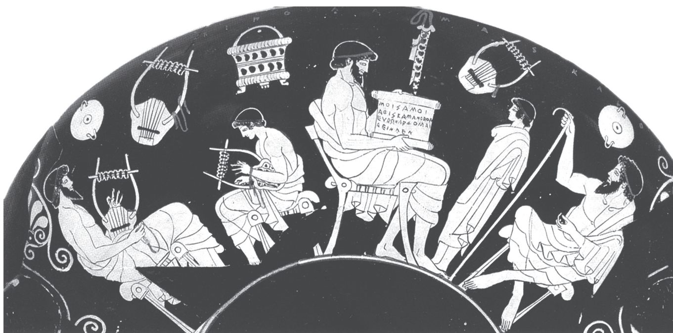
3. kép. Iskolai jelenet attikai vörösalakos csészén: grammatistés papirusztekercsel, előtte áll a tanítvány, mellette pedagógos bottal. Duris-festő, Kr. e. 480 körül (Berlin, Antikensammlung, F2285)

polistól északkeletre fekszik, jórészt feltáratlan. Maradványai alapján bizonyos, hogy a hellénisztikus korban épült. A felirat eleje, közepe és vége hiányos.