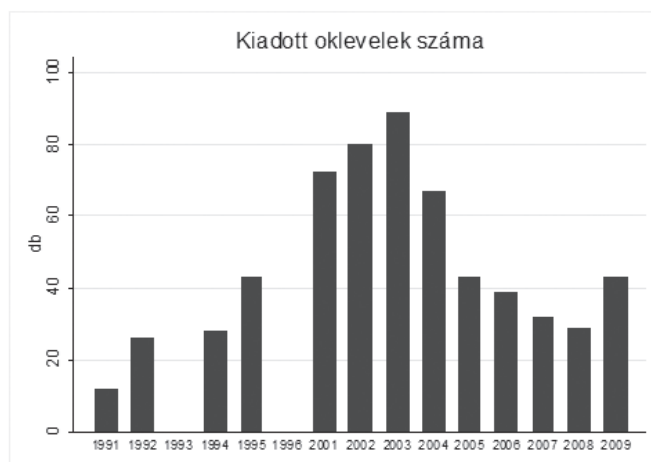
4. táblázat. A klasszika-filológia mesterképzésre (MA) felvettettek száma