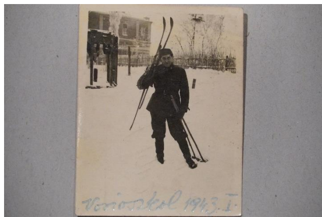
Az oroszországi Novioszkolban 1943 januárjában

A Don-kanyarból sebesülés nélkül tért haza családjához Hatvanba, hősiek helytállásáért megkapta a Vaskeresztet. Részt vett a hírhedt hatvani amerikai bombázás (1944. IX. 20) mentési munkálataiban, így is megtapasztalva a pusztítás szörnyűségeit. A háború után Hatvanban élt, a Gödöllői Egyetemi Gazdaság Nagygombosi Kerületéből ment nyugdíjba. Szolgálatát köszönjük, sokszázezer társával együtt ő is kiérdemelte az utókor háláját.