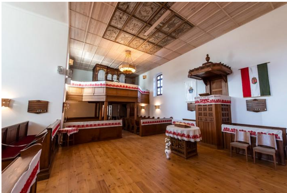
A kenderesi református templom

–Ezt a Horthy család tiszteletére faragtatták a hűséges kenderesiek – mutat a homlokzatába vésett 1938-as évszámra a nagytiszteletű úr. – A kormányzó úr mindig a szélén foglalt helyet a vasárnapi istentiszteleteken. És – lép kettővel odébb – itt, ezen a helyen keresztelték meg 1868-ban, majd földi maradványainak hazatérésekor itt tartották a megemlékezést.