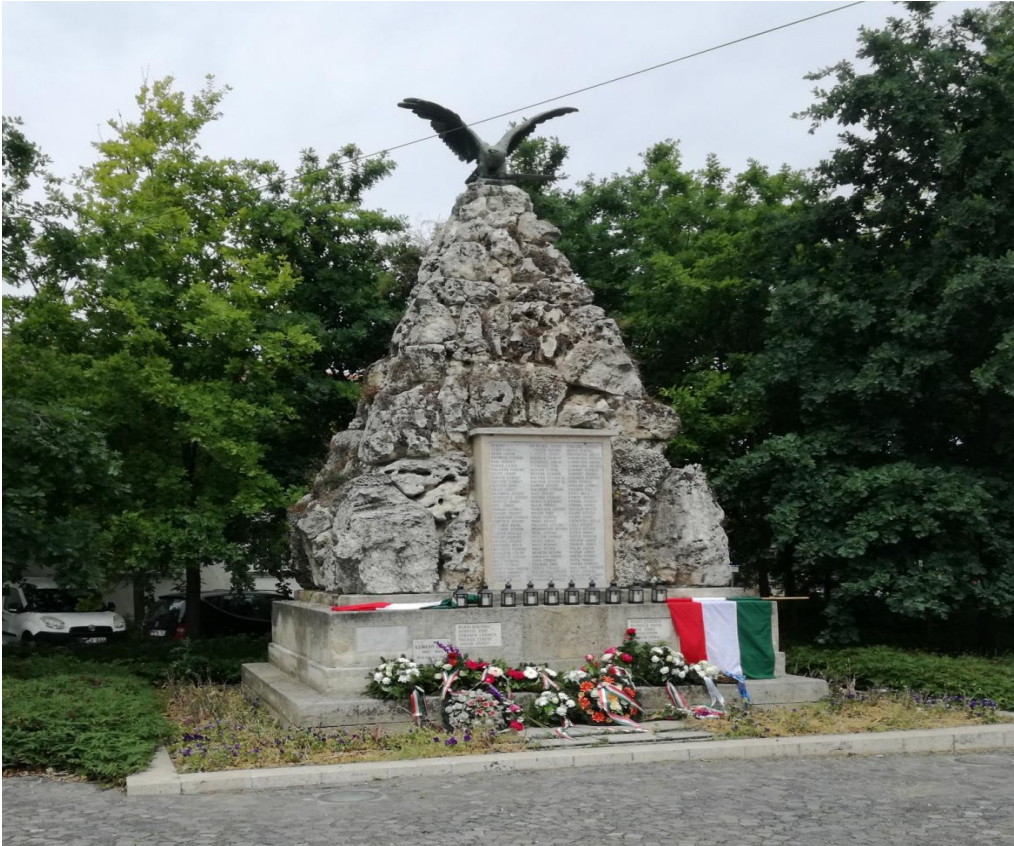
A nagytétényi Hősi Emlékmű

A tétényi emlékművön feljegyzett nevek, számunkra a háború katonái, hősei, de családjaiknak, leszármazottaiknak az apa, a nagyapa, a dédapa is. S minden név mögött ott egy történet a frontról, a csatákról, a küzdeni akarásról. Szükszavú levelek a családoknak, de hát a fontos az, hogy él, hogy a körülményekhez képest jól van. Katona, vitéz, hős, mely teljesíti a kapott parancsot, bármilyen nehéz legyen is az.