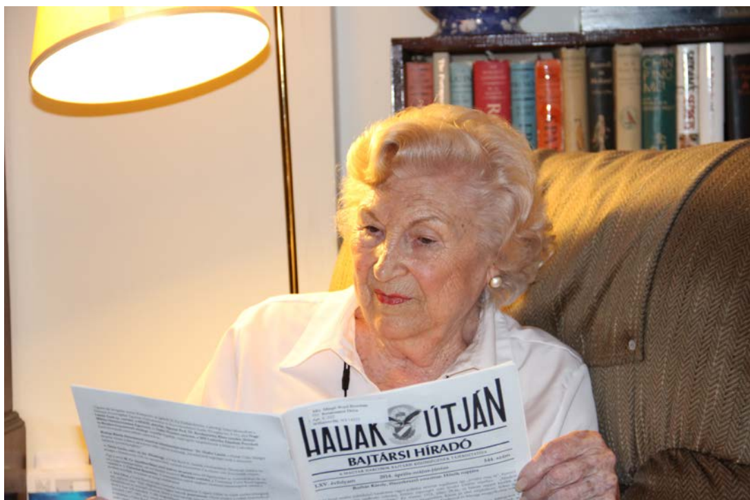
A szerkesztő felvétele, 2014