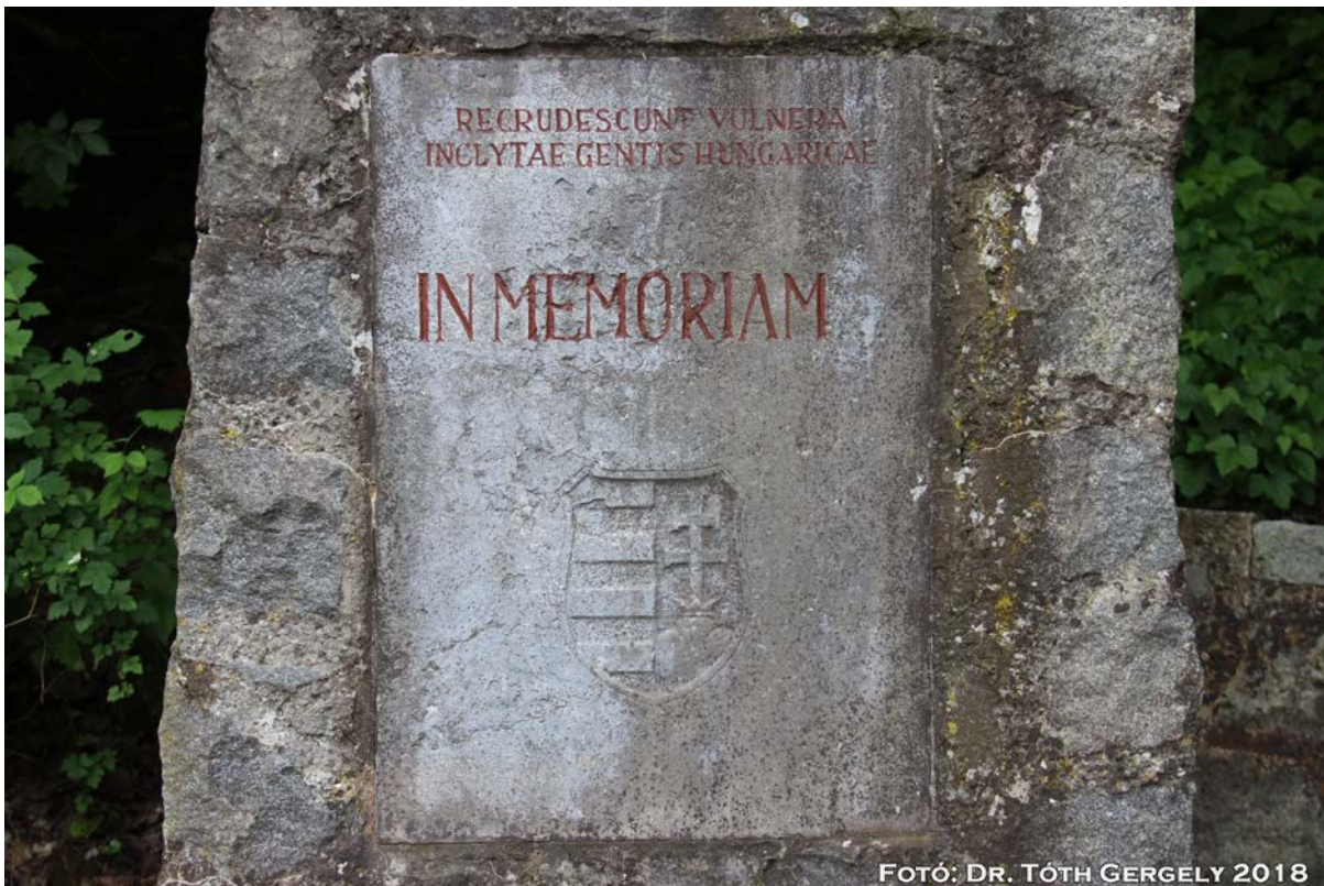
A landshuti emlékmű. Felirata magyarra fordítva: Ismét kiújultak a jeles magyar nemzet sebei.