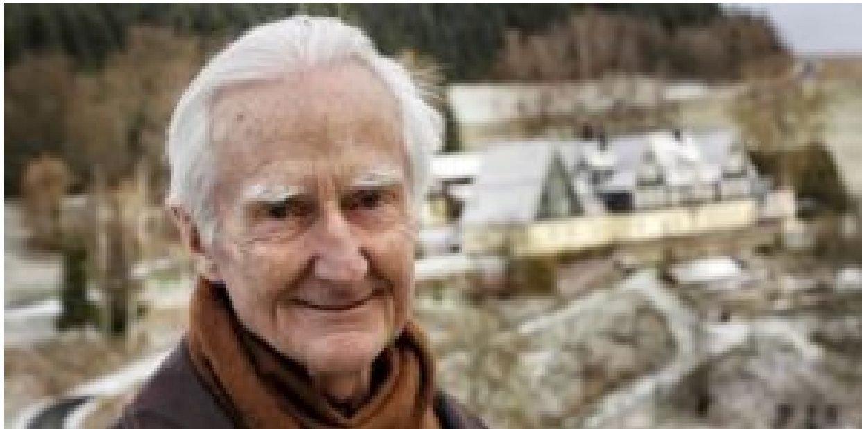
Jálícs Ferenc SJ 2013-ban, háttérben Gries-i lelkigyakorlatos házával

Jálícs Ferenc 2017 nyarán visszatért Magyarországra. Az utóbbi években a budai Farkas Edith Katolikus Szeretetotthonban élt, ahol a külvilág egyre inkább elvesztette a jelentőségét számára; mindennapos társa lett a belső csend, a szakadatlan figyelem és az örökös jelenlét. Amikor pénteken Vízi Elemér jezsuita tartományfőnök hírére vette, hogy állapota válságosra fordult, a járványügyi óvintézkedések betartásával meglátogatta, feladta neki a betegek kenetét, és megköszönte neki egész életét és szolgálatát. Ferenc atya így, a szentségekkel megerősítve, békésen tért meg teremtőjéhez.