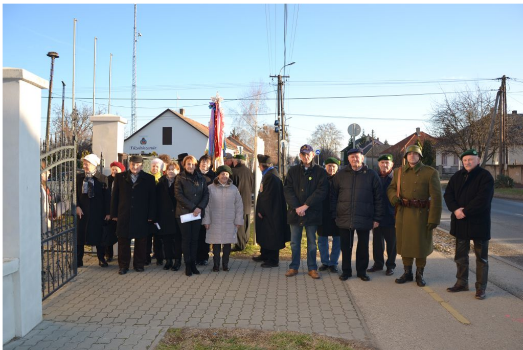
Az emlékező magyaróváriak