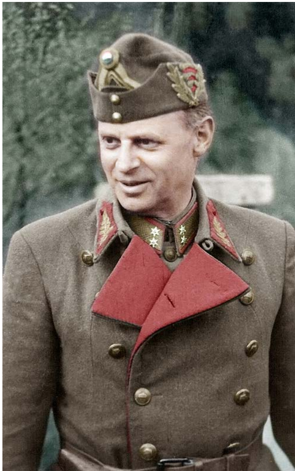
vitéz kisbarnaki Farkas Ferenc altábornagy 1944-ben a Tatár-hágónál

emigrációban 1945 és 1956 között , Budapest 2004).