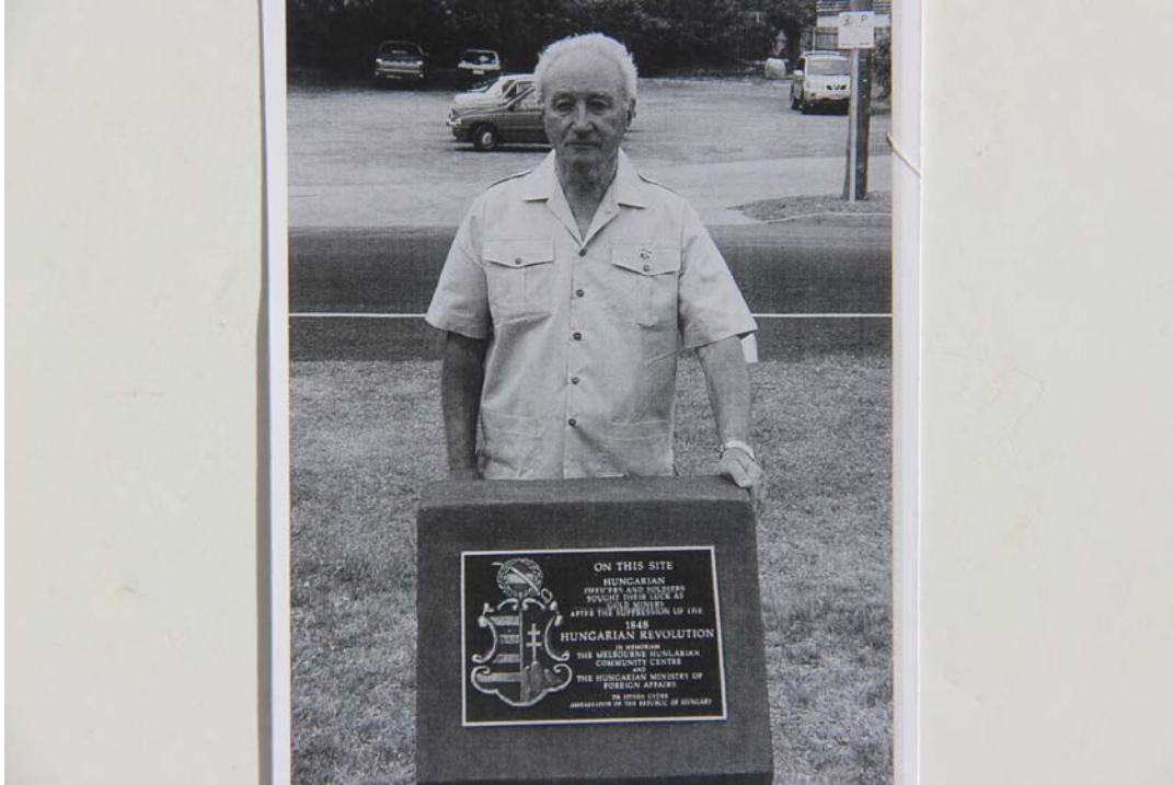
A bendigói emlékmű, mögötte v. Szmolnik Lajos

Külgyminisztérium támogatásával jött létre, Zágon Lajos melbourne-i építészmeérnök tervei alapján. Gondolta volna valaki az akkoriak közül, hogy emlékükre 149 évvel később itt emléktáblát állítanak? A helyi magyarok azóta Bendigót is egyféle zarándokhelynek tekintik, gondolva 1848 és 1956 szoros kapcsolatára is.