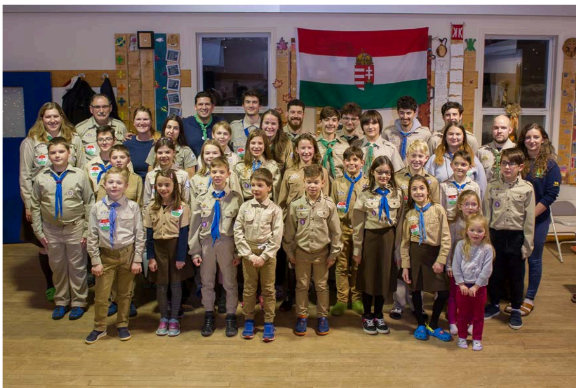
A Calgary cserkészek foglalkozásaik helyszínén, a Szent Erzsébet magyar templomnál (a szerk.)

A foglalkozások fáradalmait az ebéd mellett pihenhették ki a cserkészek, majd kaphattak új erőre, mielőtt elérkezett volna a tábortól való búcsúzás. -Zászlólevonás után a táborozók mindent összecsomagoltak, a táborhelyet kitakarították – mert a cserkész tisztábban hagyja el a táborozó helyet, mint ahogy kapta – egymástól elbúcsúztak, és sok szép új emlékekkel birtokukban, hazaindultak.