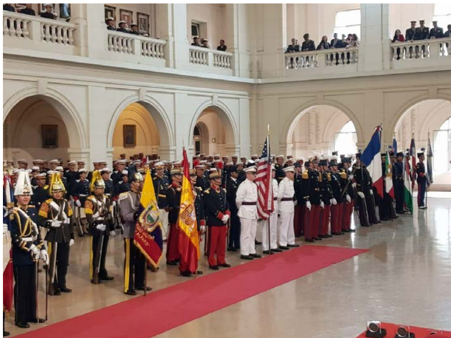
Az első sor jobb szélén a magyar küldöttség Magyarország zászlajával