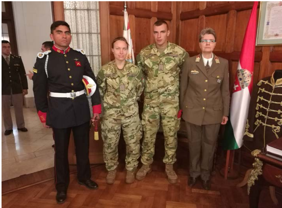
A magyar küldöttség egy argentin tiszttel a Czetz-emléksarok előtt

Czetz négy évig – 1874. május 24-ig – állt az általa szervezett intézet élén. 1 Emlékét az aulában látható mellszobra, a róla készült festmény, a kápolnában elhelyezett urna, és az akadémia múzeumában található emléksarok őrzi. A múzeumi emléksarokban magyar címeres lobogó áll. 2004 augusztusában a Hadtörténeti Intézet és Múzeum Czetz János halálának 100. évfordulójára tervezett kiállításra, emlékének ápolására hadtörténeti relikviák másolatát adományozta a Colegio Militar de la Naciónnak, egy magyar tábornoki öltözetet 1848-1849-ből, 1837 M gyalogostiszti szablyát és egy 19. századi katonaládát a Czetz nemzetség hagyatékából. Itt látható egy dobozban életének három meghatározó helyéről (Piski, Gidófalva és Nagyszeben) származó föld. Az 1848/1849-es forradalom és szabadságharc legfiatalabb tábornoka 1904. október 6-án távozott el a Hadak Útjára, az argentin hadsereg ezredesét szeptember 7-én katonai tiszteletadás mellett helyezték örök nyugalomra Buenos Aires Recoleta temetőjében. 1969. október 10-én a Colegio Militar de la Nación alapításának 100. évfordulóján hamvait a recoletai temetőből átszállították és az iskola kápolnájában helyezték el. 2