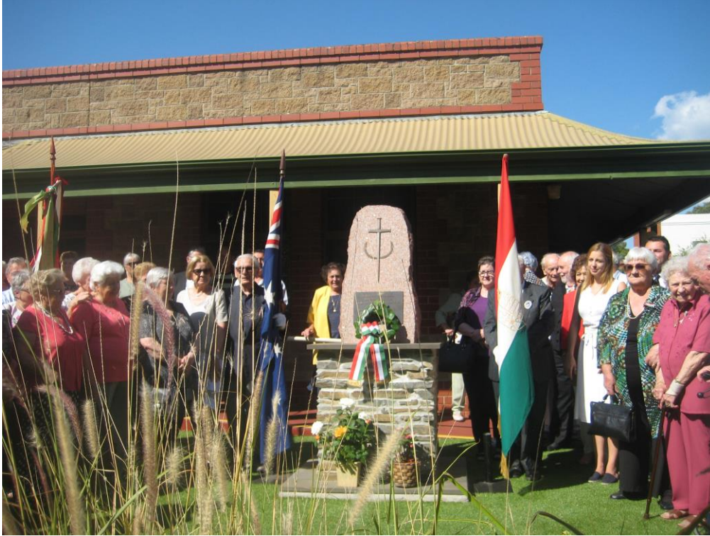
Adelaide, magyar hősi emlékmű a Magyar Ház előtt