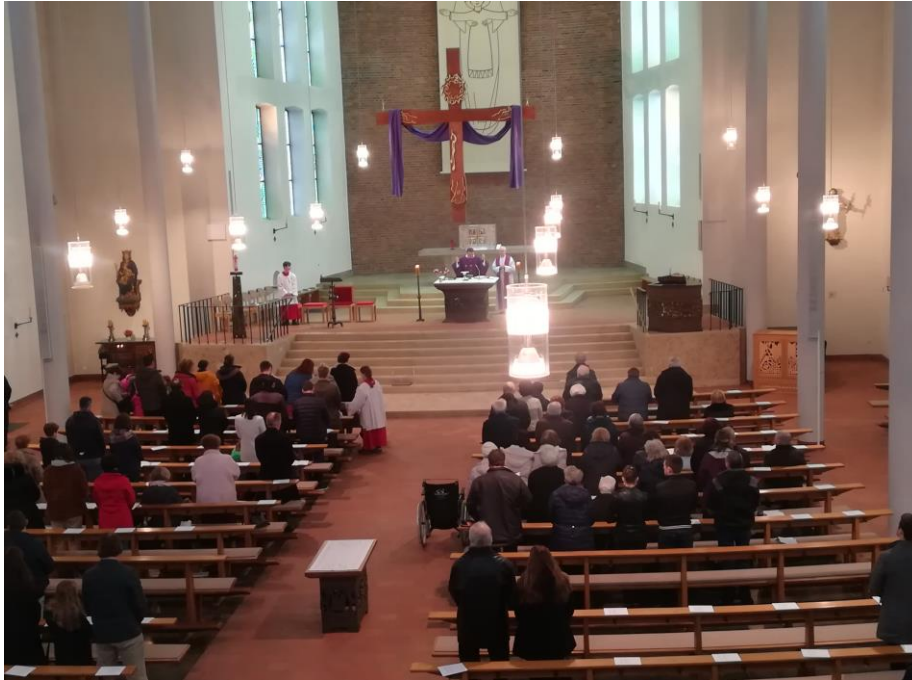
Köln, a magyar szentmisék otthona