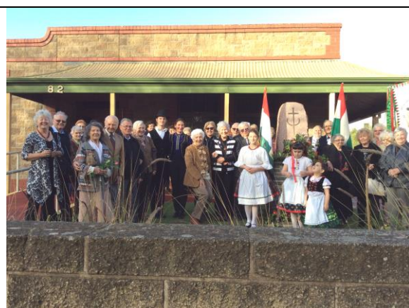
Csoportkép az emlékműnél.