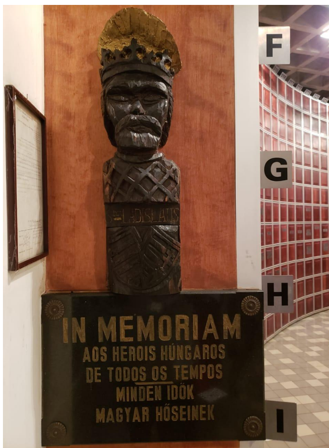
Emléktábla a mindenkori magyar hősök emlékére Sao Paolo Morumbi negyedében a magyar bencés alapítású templom kriptájában, fölötté Szent László faragott szobra.

Hungaro). Ezt a 1996-ban avatták fel és Árpád fejedelem emlékműve díszíti.