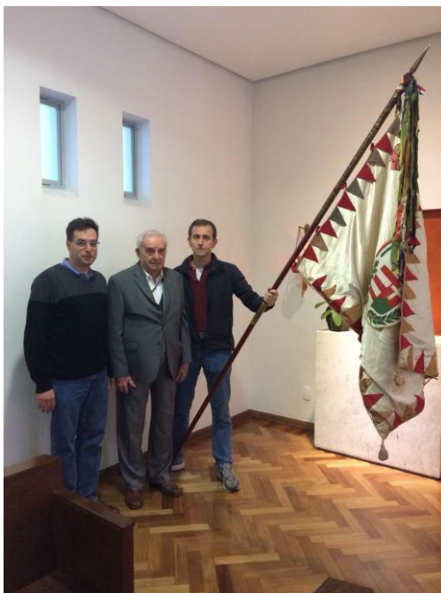
Az MHBK-zászló a 2018-as Hősök miséjén