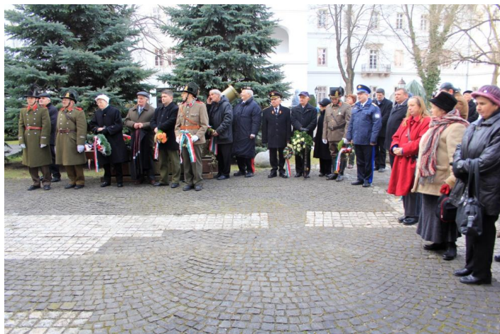
A résztvevők a Hadtörténeti Intézet díszudvarán.

Az elnök az elnökség nevében köszönetet mondott az Egyesület hűséges tagságának, hazai és külföldi (tengeren túli és a környező országokban élő) bajtársainknak, szimpatizánsainknak az Egyesület önzetlen támogatásáért. Ismertette a külföldi bajtársak csendőrnapi küldött üdvözleteit, jókívánságait.