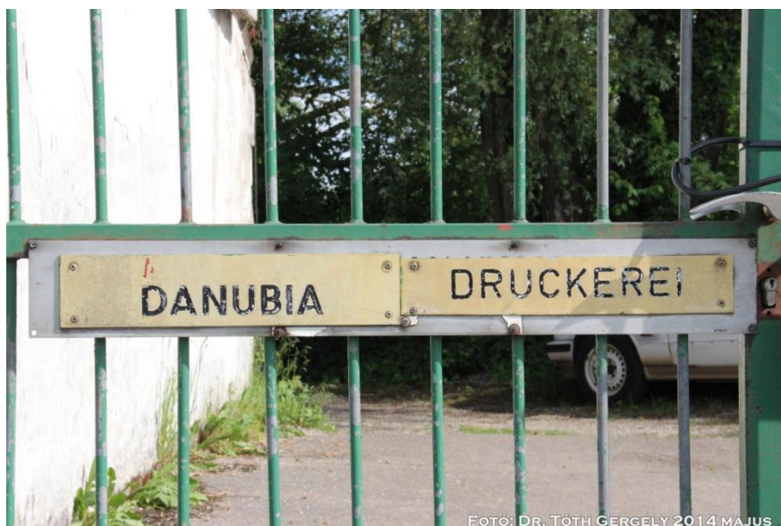
Az akkor már nem működő Danubia Druckerei bejárata 2014-ben.

A Nemzetőr a világ minden olyan pontján jelen volt, ahol magyarok éltek, az utolsó szám még mindig feltüntet terjesztőket Angliában, Argentínában, Ausztriában, Belgiumban, Dél-Afrikában, Franciaországban, Magyarországon (ahol a lapot a kommunisták 1989-ig szigorúan tiltották, hiszen rettegtek tőle), Svájcban, Svédországban és Venezuelában. Második és egyben utolsó főszerkesztője Nyitrai Gyula volt, az ő majd húszéves hűséges munkáját ezúton is köszönjük.