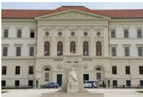
A Ludovika világszínvonalon felújított épülete, ma Nemzeti Közszolgálati Egyetem

Az ekkor lezajlott utolsó hadnagyavatás emlékeztet benünket arra a több mint 300 bajtársunkra, kik e napon nyerték el az arany csillagot és lettek honvédtisztek, és akik közül sokan az avatásunk után rövidesen hősi halált haltak. Emléküket sohasem szabad elfelejtenünk! Példájuk legyen lobogó fáklya a magyar éjszakában és mutassa az utat honvédségünk későbbi nemzedékei számára a hazaszeretet és a nemzetünk jövőjébe vetett töretlen hit felé.