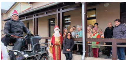
Érkezik a Mikulás