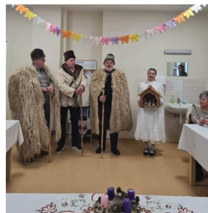
Betlehemezők a klubban