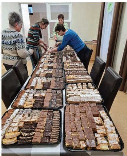
Készülődés a Betlehemes találkozóra