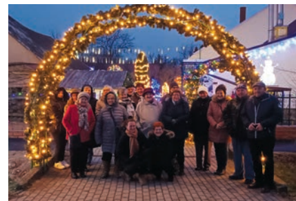
A karácsonyi fények nyomában