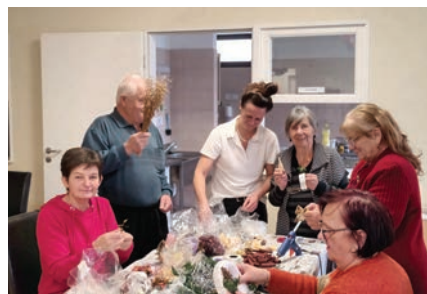
Karácsonyi kézműveskedés a klubban