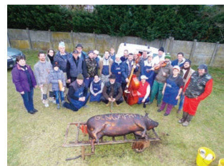
Ismét jól sikerült a Gencsapáti disznótoros farsangi multság – részletes beszámoló a Hírmondó márciusi számában.