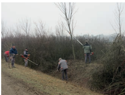
Ároktisztítás a cseresznyés úton