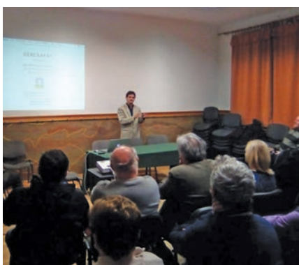
Lakossági Fórum január 23-án a Helyi Építési Szabályzat (HÉSZ) jogharmonizációs módosításával kapcsolatban