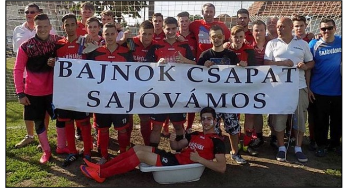
Az aranyérmes ifjúsági csapat tagjai

A csapat ellentmondást nem tűrően utasította maga mögé a mezőnyt, amit az elért 26 győzelem mellett jelez a 138 rúgott és a mindössze 22 kapott gól is. Remélem a fiatalok ezt az eredményt nem tekintik pályafutásuk csúcának, és az új bajnokságban közülük jó páran már a felnőtt csapat újbóli sikereiért fognak küzdeni.