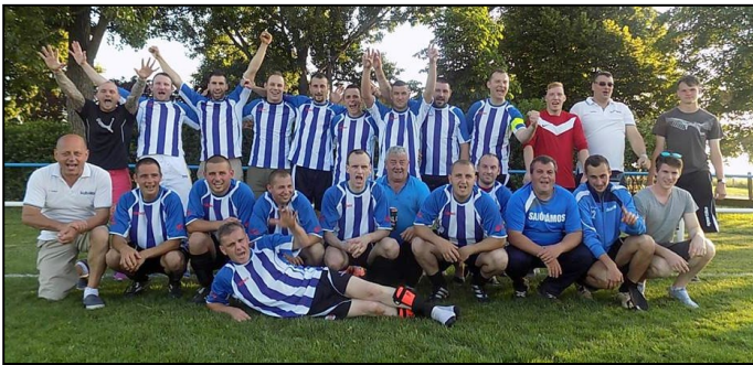
A bronzérmes csapat tagjai

A 13. fordulójáig veretlen felnőtt csapatunk, elmaradt ugyan az őszi szerepléstől, de így is magabiztosan szerezte meg a bajnokság 3. helyét, 6 ponttal megelőzve a 4. helyezettet és csak két ponttal szorult le az ezüstérmes pozíciótól. A csapat ezzel a szerepléssel beállította saját legjobb eredményét, megismételve a 2000-es évek elején elért bronzérmes helyezést.