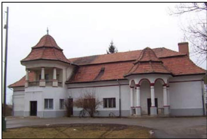
Napközi Otthonos Konyha épülete régen