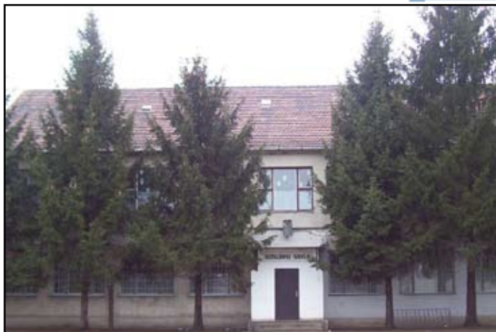
A régi iskola épülete