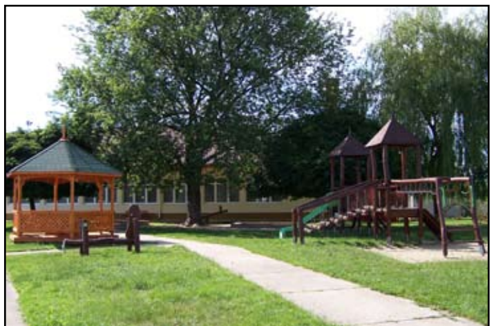
Az új óvoda udvara