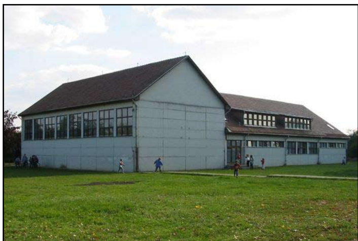
Tornaterem felújítás előtt