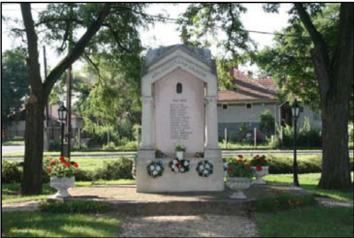
I-II. Világháborús Hősi Emlékmű