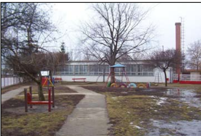
Óvoda udvar régen