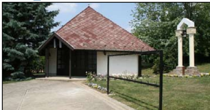
Ravatalozó, léleklarang napjainkban