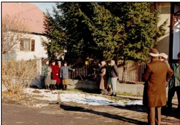
Gázláng meggyűjtása 1993