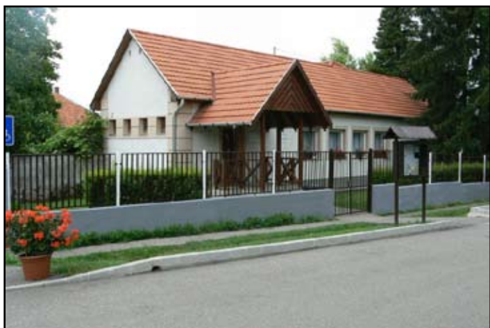
Orvosi rendelő napjainkban