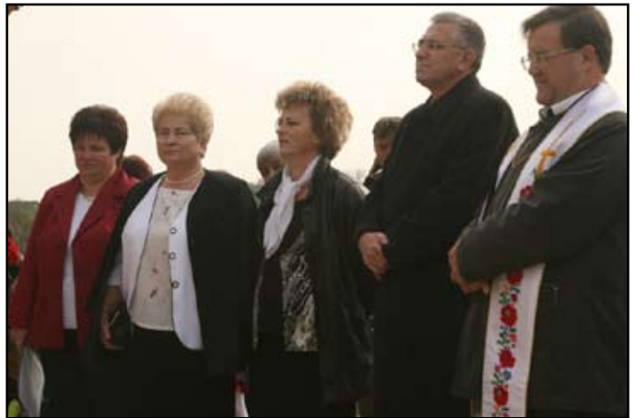
Óvoda átadási ünnepség