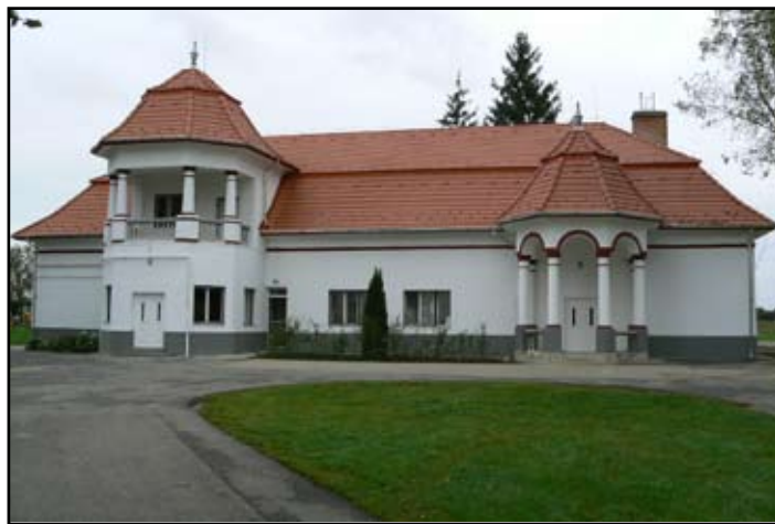
Napközi Otthonos Konyha felújítás után