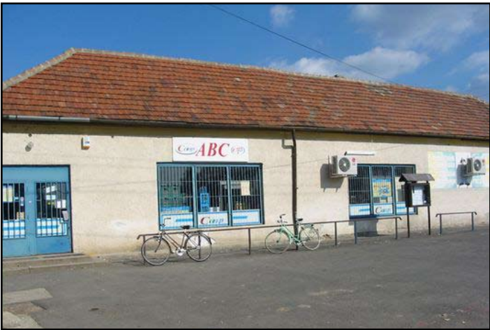
COOP Áruház 2002-ben