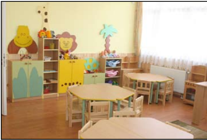
Új óvoda belső