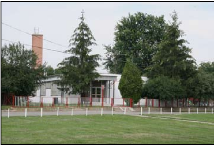
Óvoda felújítás előtt