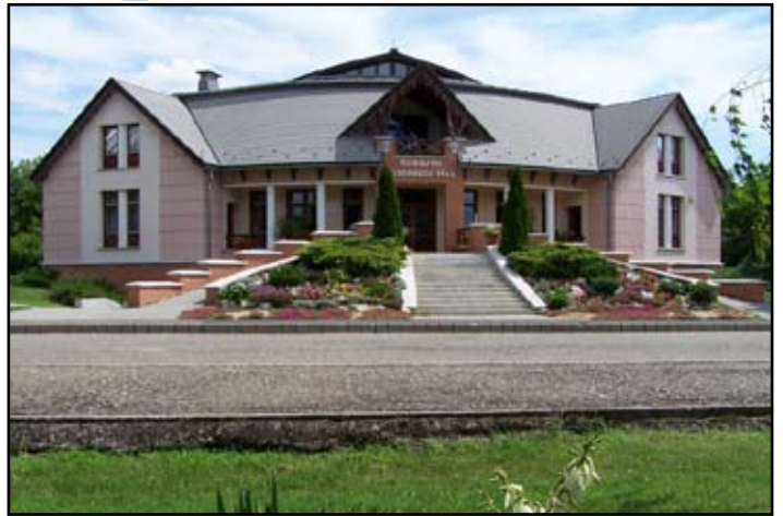
Kossuth Községi Ház