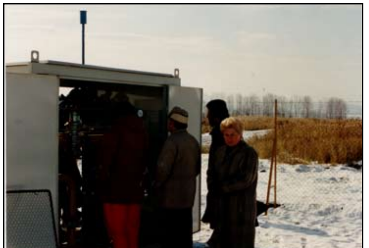
Gázfogadó Állomás átadása 1993