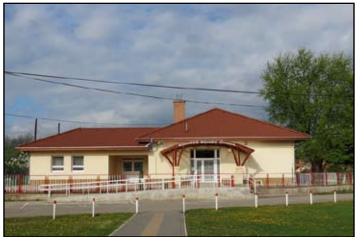
A megújult „Kincses Sziget” óvoda