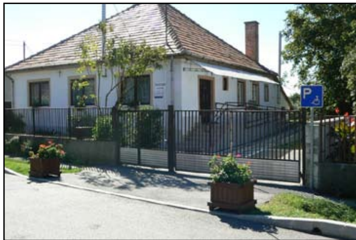
Tanácsadó épülete felújítás, akadálymentesítés után