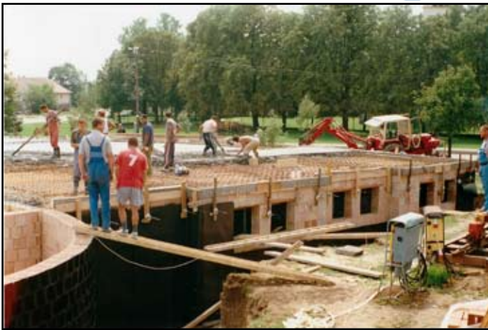
Érpülő Községi Ház