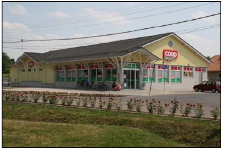
COOP Áruház napjainkban