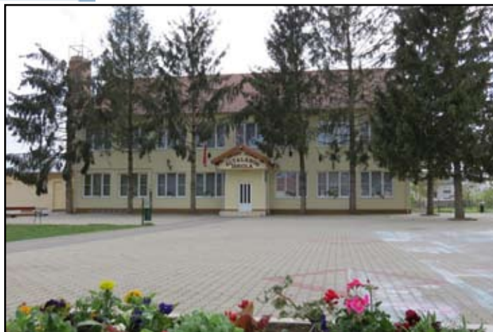
A felújított „Arany János Általános Iskola” épülete