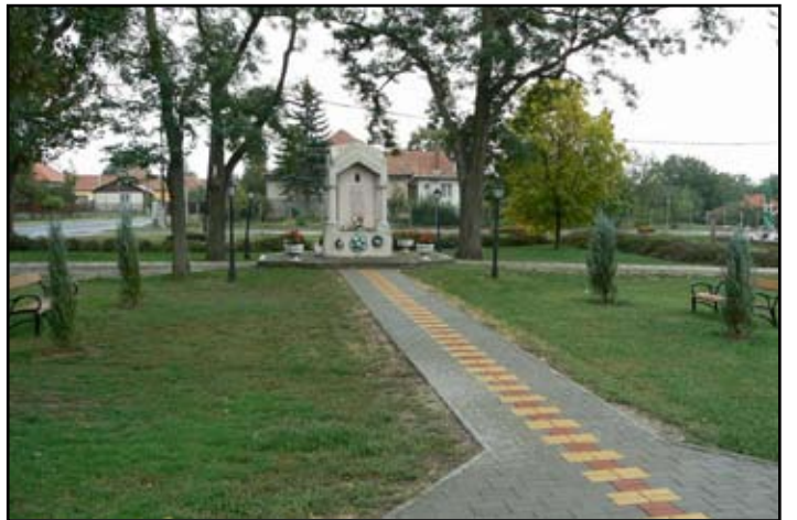
I-II. Világháborús Hősi Emlékmű új térburkolatú járda és parkosítást követően