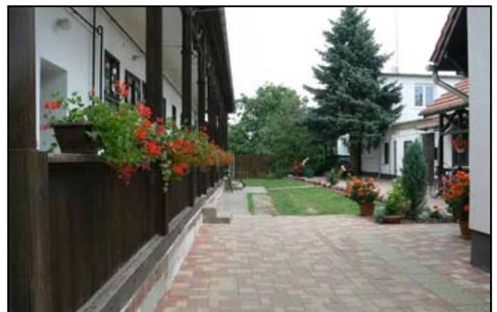
Polgármesteri Hivatal belső udvara