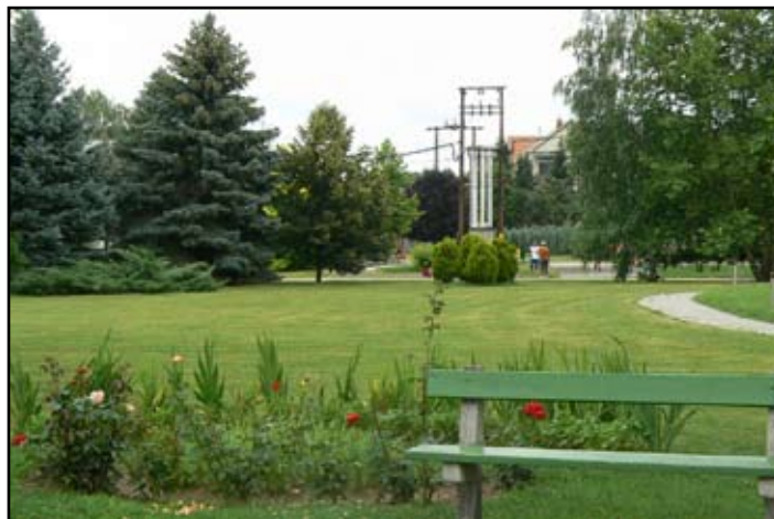
Kossuth Közösségi Ház Parkja