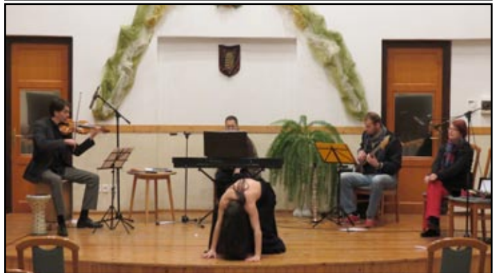
A képen: Viharlámpa Project

Ezek az események kiszakítanak a hétköznapokból, egy másik világot tárnak elém. Nagyon érdekes és fontos látni, hogy nemcsak úgy lehet élni és gondolkodni, ahogy azt én teszem, vagy a szűk környezetemben látom. Ezért jó olvasni könyveket, nézni filmeket, színházi és más művészeti előadásokat látogatni. Mindezek segítenek élni - mint a gyerekeknek a mese - mintát mutatnak, megerősítenek, helyre tesznek, megmutatják az élet szépségét, segítenek feldolgozni a nehéz helyzeteket, kikapcsolódást nyújtanak és hosszan sorolhatnám.