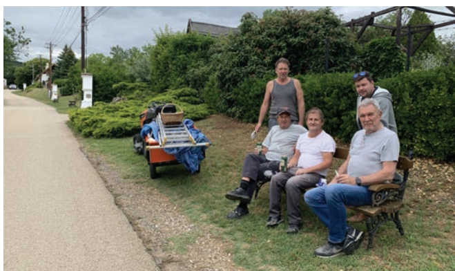
Be van fejezve a nagy mű, igen. A mész szárad, az alkotók pihennek