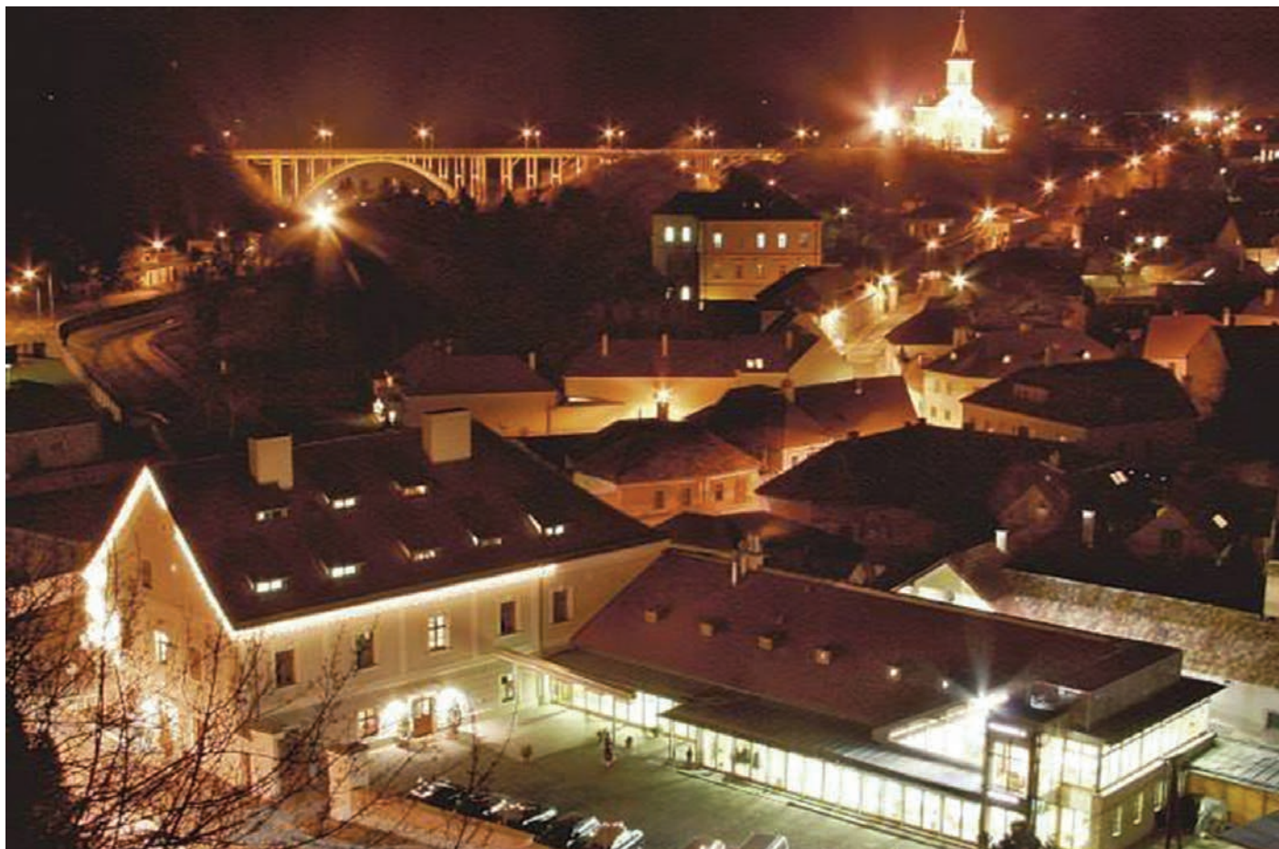
Ilyen esti fényben a Várból letekintve a hotelre.