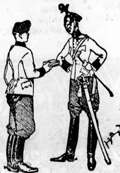
Itkaol még most sem jögzött meg inagúnak, hogy csak Jacobi antinocin szivarok-hüvelyk szivok!