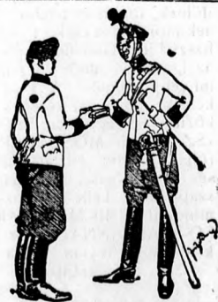
Fickel! Még most sem jögzötted meg magadnak, hogy az JACOBI antinicotin elváriak-hányvált szivok!