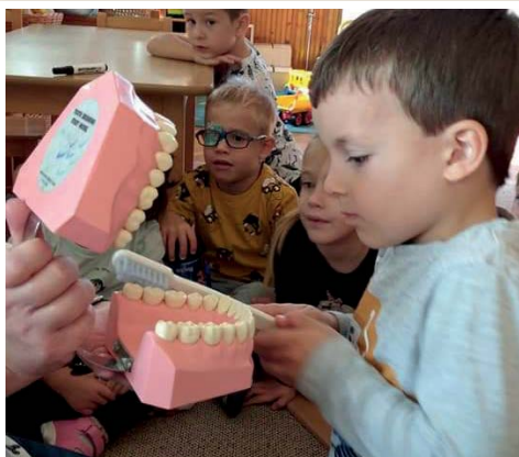
Egészségét az óvodában 9. oldal