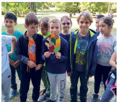
A diákönkormányzat túranapja 7. oldal