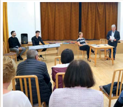
Zenés könyvbemutató a művházban 12. oldal