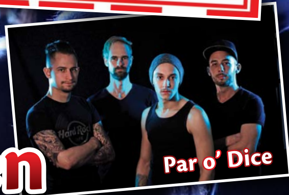
Par o' Dice