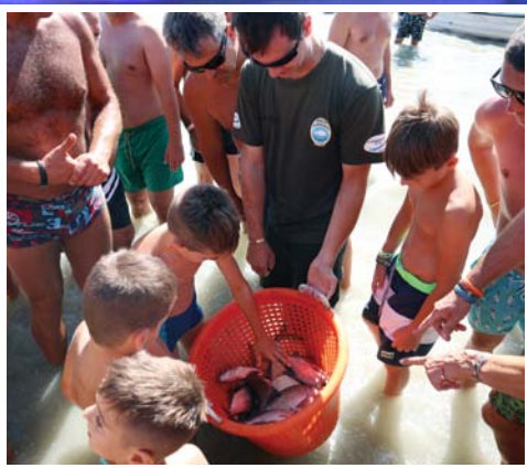
Halat fogtunk! 2. oldal