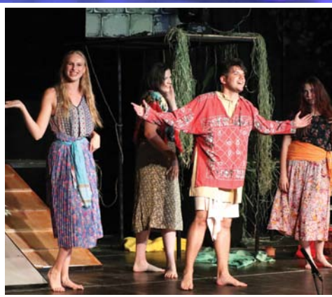
Rendkívül népszerű a Szeretetszínház 12. oldal