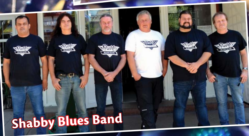
Shabby Blues Band