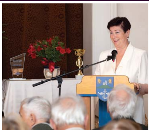
20 éve kezdődött...