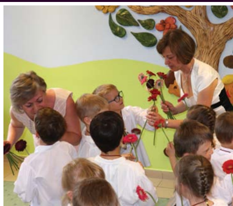
Elballgott a nagycsoport