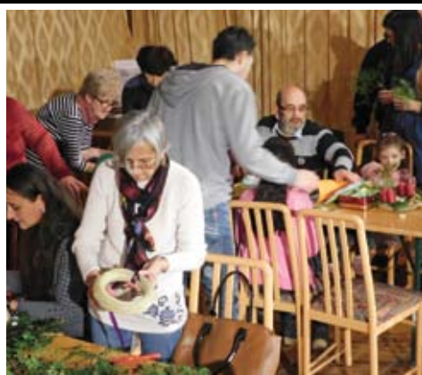
Adventi programok kicsiknek, nagyoknak 11. oldal