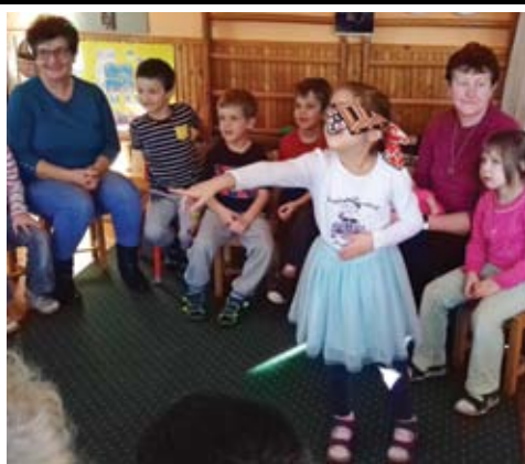
Nagyszülők napja az óvodában 8. oldal