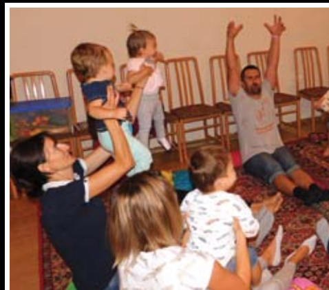
Zenebölcsi a legfiatalabbaknak jövőre is 11. oldal