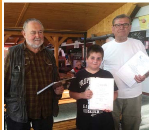
Horgászverseny 11. oldal