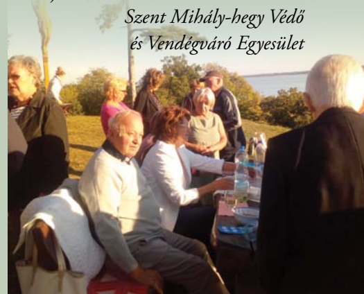
Szent Mihály-hegy Védő és Vendégváró Egyesület

Jóízű beszélgetéssel telt el a délután. Amíg e kis társaság tagjainak lelkében lobog a tenni akarás lángja, amíg jól érzik magukat egymás társaságában, addig védve lesz a hegy, annak minden csodájával.