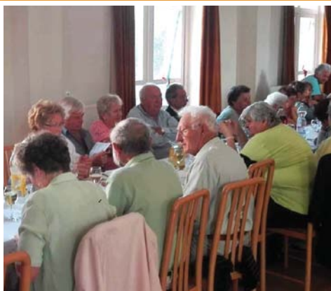
Elindult a klubszezon 7. oldal