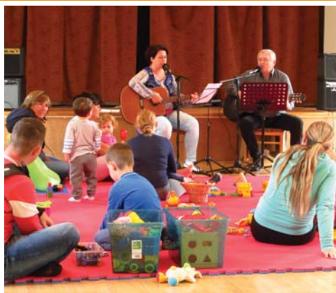
Könyvtári napok, kicsiknek, nagyoknak 6. oldal