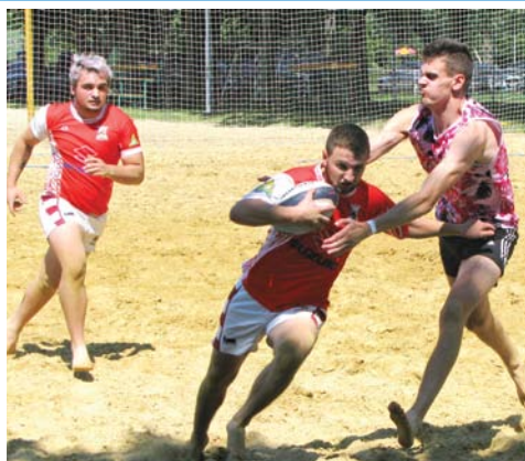
Újabb sportág versenye strandunkon 6. oldal