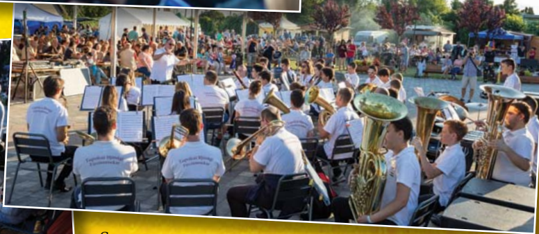
Szentgotthárd és Tapolca város fűvósai is a fesztivál vendégei voltak

Ismét tűzgyújtással ünnepeltük Szent Iván éjszakáját. A Zalai Balaton-part Ifjúsági Fűvószenekar és a Vonyarcvashegy Mazsorett Csoport műsora után a Boombatucada dobegyüttes ritmusára gyújtottuk meg a máglyát, melynek fényénél egy meghitt hangulatú este részesei lehettek a jelenlevők.