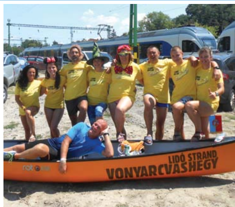
Vonyarcai evezősök a Balatonon 6. oldal