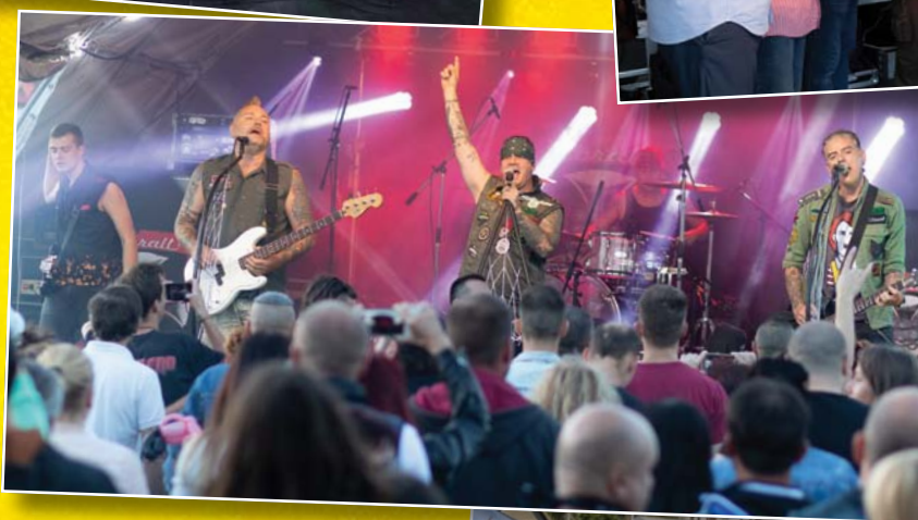
A Zorall együttes sajátos stílusa sokak kedvence