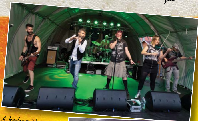
A kedvezőtlen időjárás ellenére a Firkin zenekar lendületes ír zenével varázsolta el a közönséget

Június végén került megrendezésre a fűvószenekari fesztivállal egybekötött nagyszerű sörfesztivál. Bár az időjárás megtréfálta a szervezőket és a közönséget, minden tervezett programot sikerült megtartani, s ami legfontosabb, mindezt remek hangulatban.