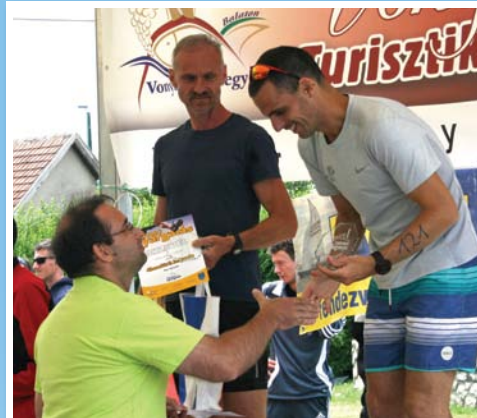
Hazai versenyen hazai siker 9. oldal