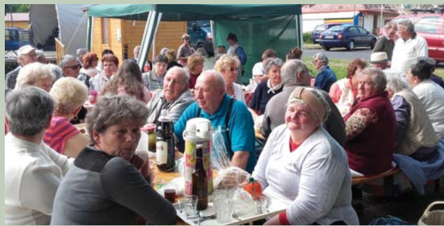
A Nyugdíjkorúak klubja szinte teljes létszámmal képviseltette magát, a Nőklub tagjaival közös csapatban vettek részt a főzésben