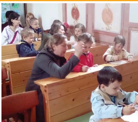
Madarak és fák napja a hegyen 9. oldal