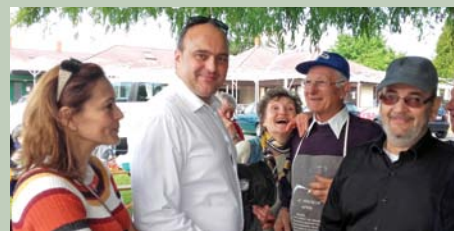
Polgármester úr is végiglátogatta a vidám közösséget