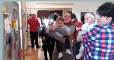
A babafotó-kiállítást mindig nagy szeretettel nézik meg az érintett családok és a vendégek egyaránt