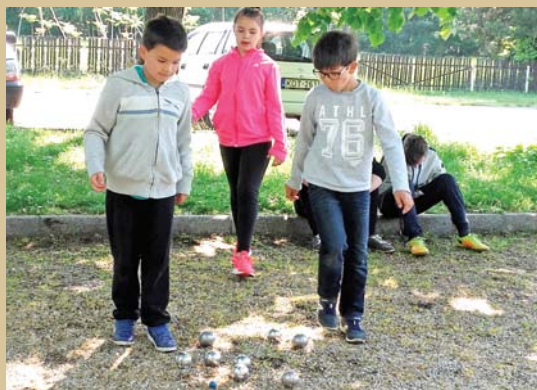
A győztes Kicsik csapata játék közben

Több, mint két évtizede ismertette meg a művelődési ház a helyi és környékbeli embereket a petanque játékkal, amikor először megrendezte a Balaton Kupa elnevezésű nyílt, triplett, nemzetközi petanque bajnokságot. Azóta ez a golyós játék népszerű, eredményes sportággá nőtte ki magát Vonyarcvashegyen.