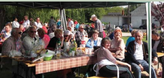
A polgárőrök vidám csapata többféle finomságot is főzött