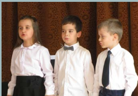
Az óvodások verseket szavaltak