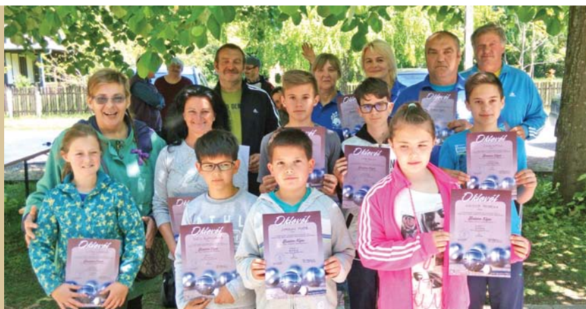
A győztes és helyezett csapatok együtt