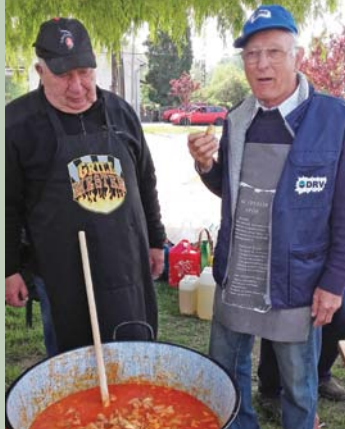
Szakértő szakács kezek, szemek ügyelik a készülő finomságot