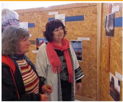
Fotóállítás testvértelépéseink szépségeiből 3. oldal