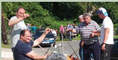
A vállalkozók klubját legaktívabb tagjaik képviselték