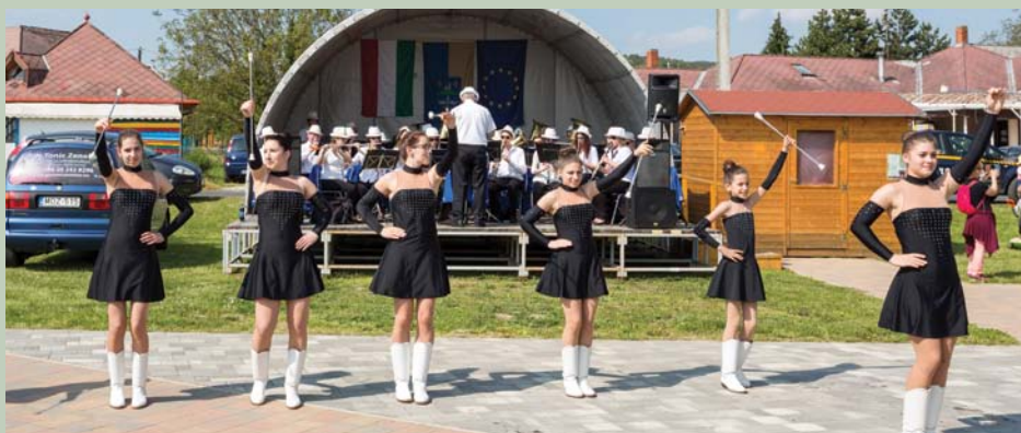
Fúvószenekarunk és mazsorett csoportunk ez alkalommal is színvonalas műsorral szórakoztatta közönségét