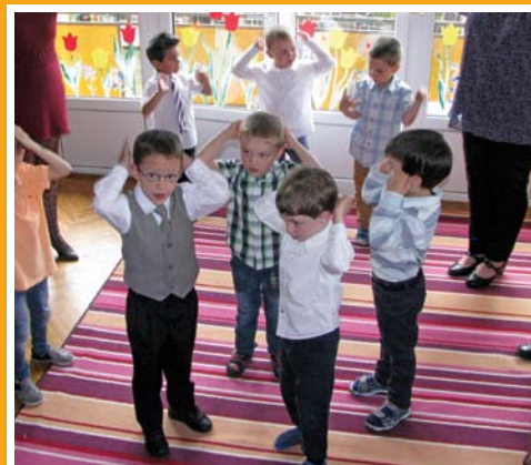
Az anyákat köszöntötték óvodásaink is 10. oldal