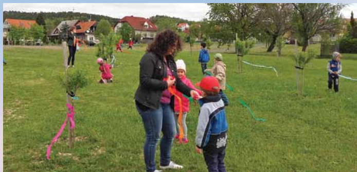
Óvodásaink színes szalagokkal ünneplőbe öltöztették a Mandulás Tündérkertet.

Hagyományőrző rendezvényeink egyike a mandulás napok, mely idén is színes programokkal várta az érdeklődőket a mandulához kapcsolódó helyszíneken. Ezek: a Mandulás Tündérkert, a Helikon Taverna és a Mandulás utca.