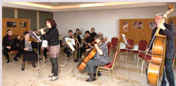
Nagy népszerűségnek örvend az immár hagyományos mandulásnapi hangverseny, melyen idén is a keszthelyi zenetanárokból alakult szimfonikus zenekart hallhattuk.