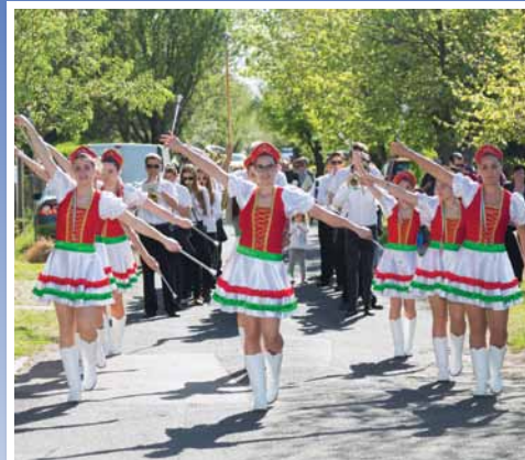
Hercegi Mandulás Napok 9. oldal