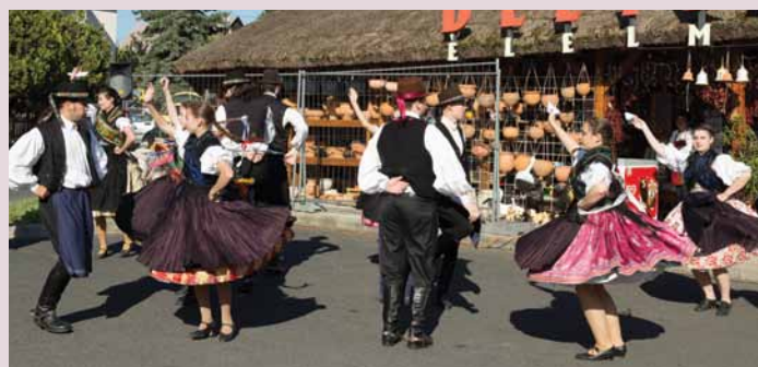
Az egykori manduláskert helyét a Mandulás utca őrzi, melyet zenésző és tánc köszöntött.