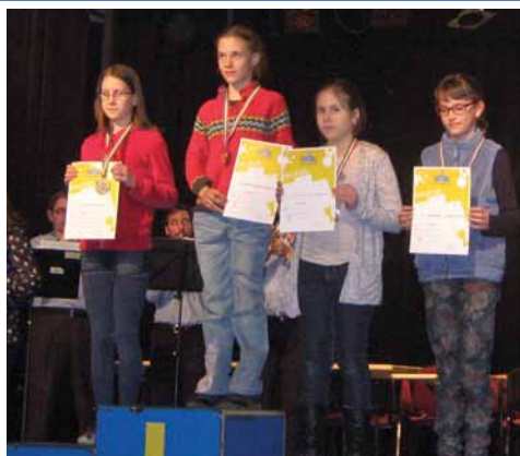
Országos első helyezett 2. oldal