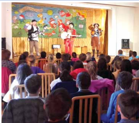
A magyar költészet napja 8. oldal