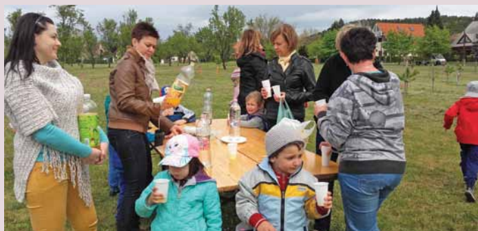
Nem maradhatott el a jól megérdemelt zsúr.