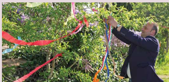
A hagyományoknak megfelelően Polgármester Úr ünnepi szalaggal díszítette a Mandulás utca egyik mandulafáját.

Vasárnap képzőművészeti kiállítás, vidám népi játszóház és a Turisztikai Egyesület tagjainak jóvoltából mandulás sütemények várták a művelődési házba betérőket.