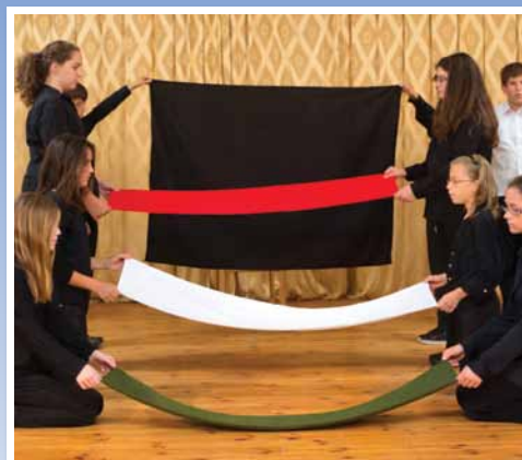
Ünnepi megemlékezések 8. oldal