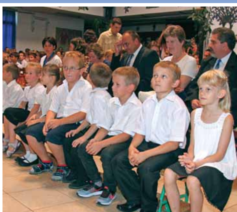
Elkezdődött a tanév 3. oldal