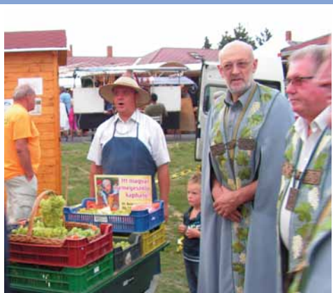
Képes fesztivál összefoglaló 2. oldal