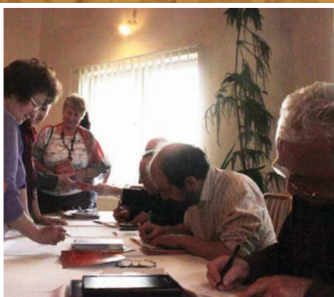
A költészet napja 2. oldal