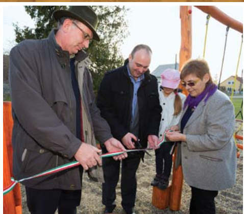
Játszótér avató 2. oldal