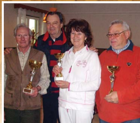
Seffer Kupa 3. oldal